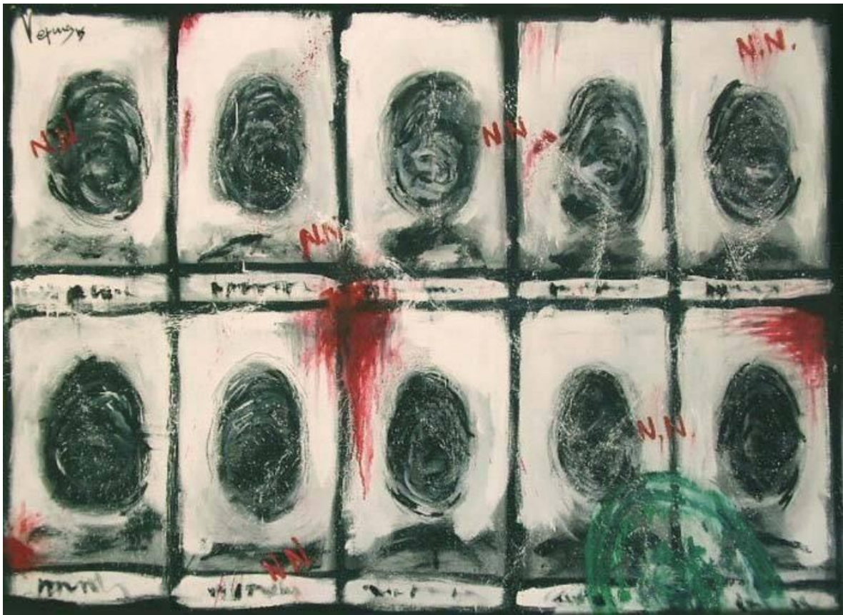
(Ignacio Vexina, 2005)