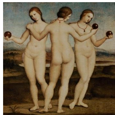
**Las Gracias. 1504, Rafael Sanzio.

El hombre comenzó aquí a cuestionar lo dado, los fundamentos de la creación del universo y del ser, y a buscar explicaciones en la ciencia y la razón. Allí se da una ruptura con el organismo que lo superaba, emerge así el individuo, el cuerpo se convierte en la frontera exacta que marca la diferencia entre un hombre y el Otro.