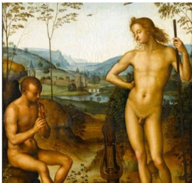
*Marsias y Apolo, 1483, Pietro Perugino.

En el arte fue donde más claramente pudo verse este despertar. Por ejemplo, la sexualidad del hombre y la mujer comenzó a definirse y remarcarse, apareciendo los genitales como parte del cuerpo.