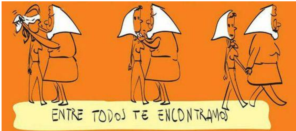
Ilustración: Lorena Ulder

Estado que en realidad debía velar por la integridad de todos sus ciudadanos, era el Estado Terrorista que los estaba matando, torturando y desapareciendo.