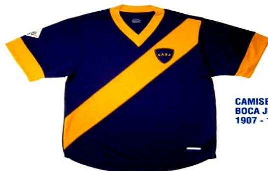
CAMISETA OFICIAL BOCA JUNIORS 1907 - 1912