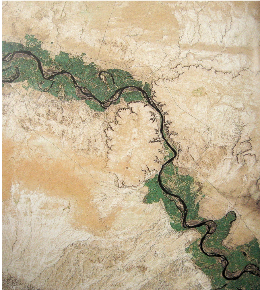
Figura 2: Vista satélite de la garganta basáltica de Hanuqa