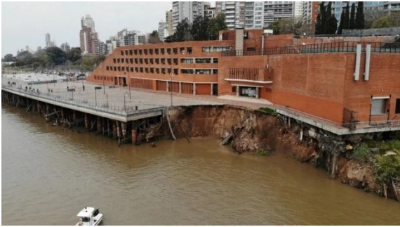
Imagen 1

En las imágenes siguientes se puede observar cómo se encuentra el Parque España hoy, y como son las obras que se deben llevar adelante; se trata de una transformación/reparación urbana pensada con la intención de agregar un nuevo atractivo turístico en el lugar, según manifestó el intendente en la entrevista realizada para este trabajo.