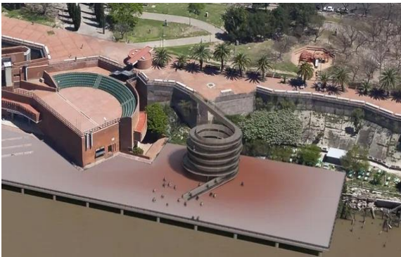
Imagen 2

En la imagen 1 se puede observar cómo se encuentra el Parque España luego del último derrumbe sucedido en Julio de 2021.