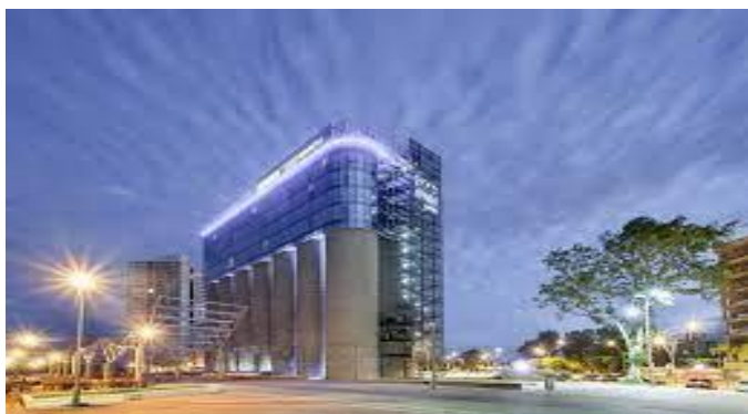
Foto: Hotel Puerto Norte Design – Revista institucional de la BCR

Como se puede observar en la imagen siguiente, muchas de las estructuras existentes fueron recuperadas; en este caso se trata del Puerto Norte Design Hotel , el cual cuenta con una capacidad para 158 alojados distribuidos en 79 habitaciones, restaurante, sala de reuniones, spa entre otras comodidades para sus clientes. Se utilizaron los silos que antes servían para el acopio de granos para construir dentro de ellos uno de los hoteles más lujosos de la Ciudad de Rosario y quizá con la mejor vista de la misma.