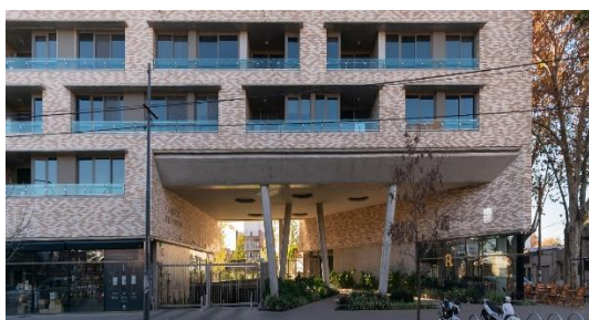
Condominios de refinería, ubicado en la calle Vélez Sarsfield al 500

Respecto a las imágenes anteriores, tanto en Puerto Norte como en Refinería, se puede observar que han surgido distintos espacios destinados a la vivienda con este formato de condominio, los cuales se tratan de viviendas colectivas en una o varias plantas que poseen espacios comunes para su uso y recreación como pueden ser piscinas, juegos para niños, parrilleros comunes, etc.