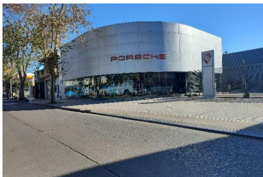
Una de las concesionarias de autos de alta gama instaladas en Puerto Norte