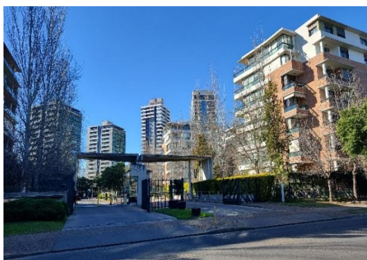
Condominios del Alto. La vida urbana y la población fija del lugar se han transformado notoriamente.