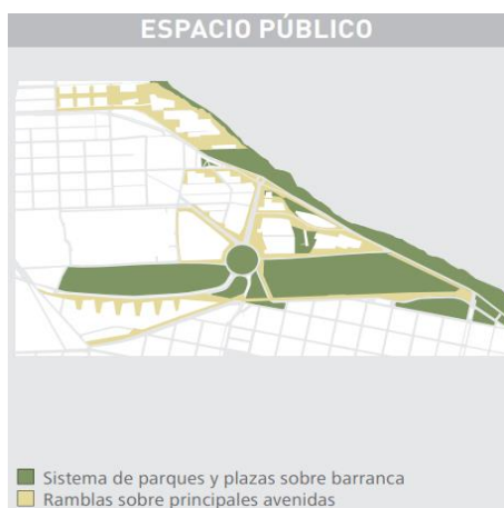
Gráfico 1. Espacios pensados y destinados al uso público dentro del diseño de Puerto Norte.