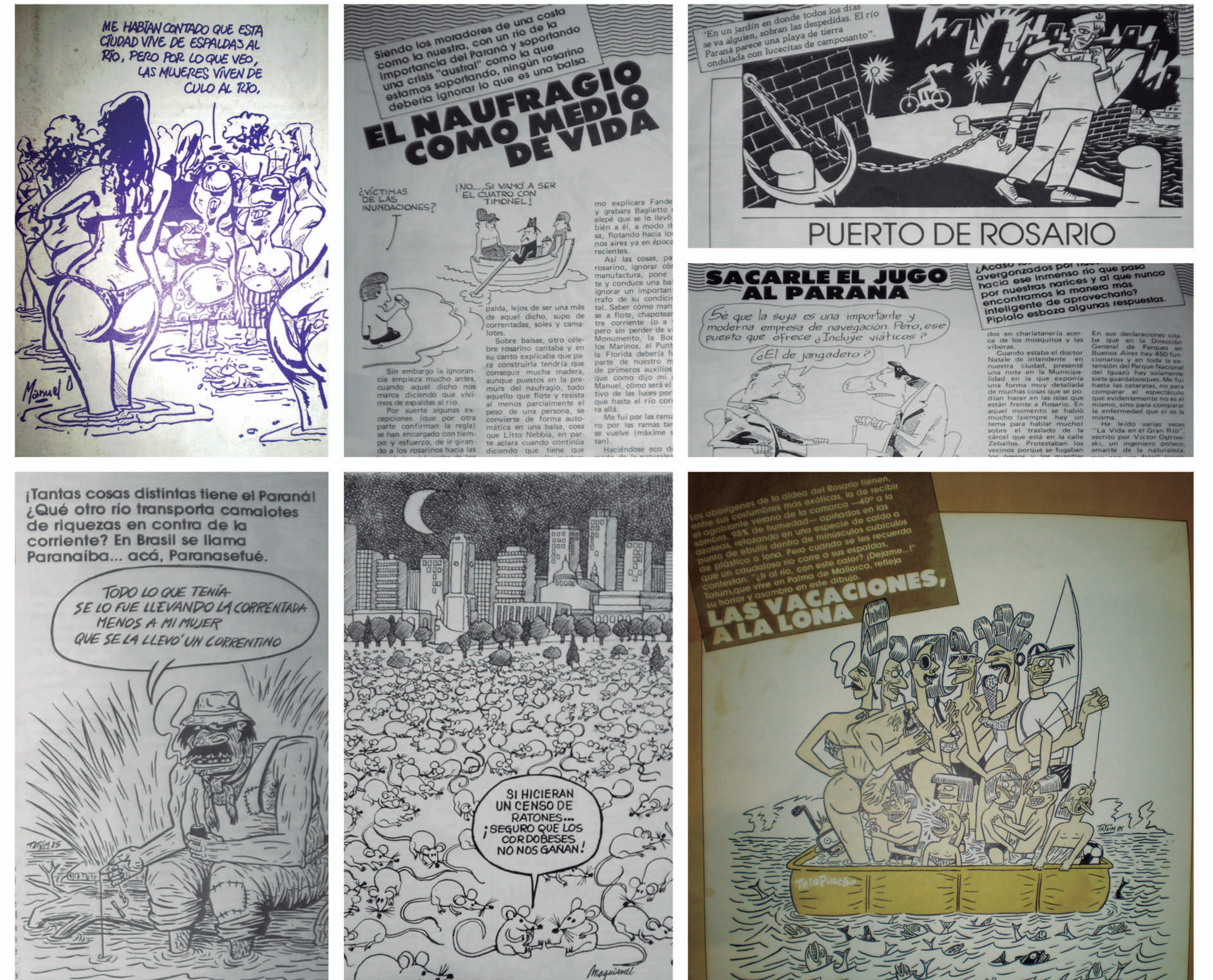
REVISTA RISARIO- ARTÍCULOS