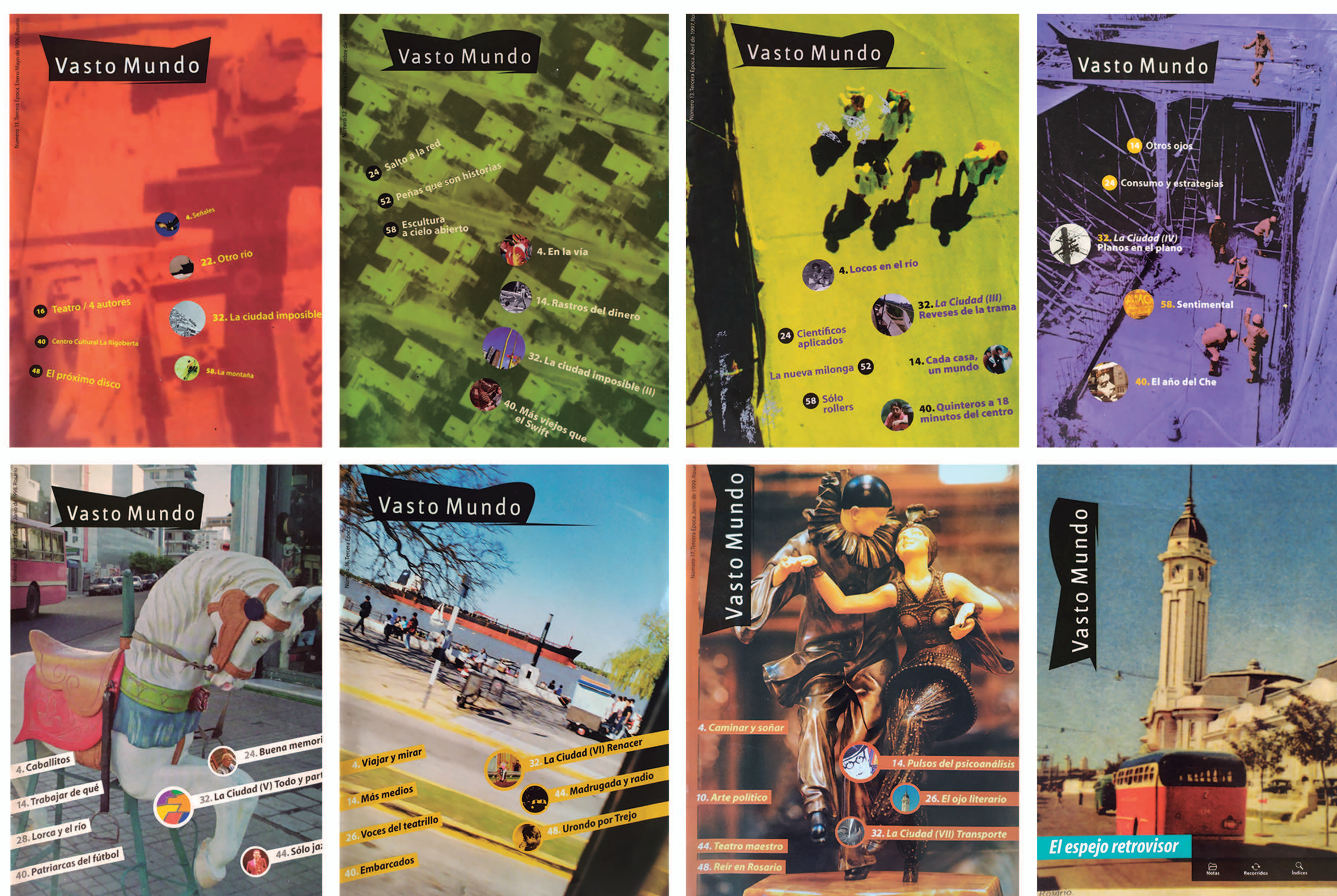
Revista Vasto Mundo (1987 - 2000)

Desde diversos registros gráficos que reflexionan sobre la identidad de la ciudad, se exhiben las diversas caras contrapuestas y simultáneas que se reconocen cotidianamente. En la década de 1990 se identifica una especial atención al conjunto de obras que promueven la reconversión de la costanera central en nuevos espacios públicos. Es así, que, junto a ese cambio del imaginario de estar de espaldas a ahora comenzar a dar la cara al río, también se fortalece la posibilidad de convertir a Rosario en una ciudad turística.