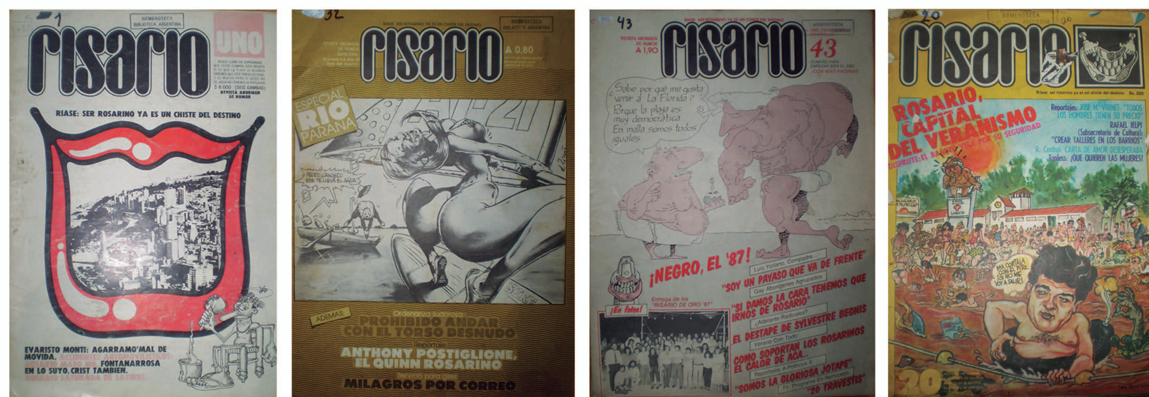
Revista Risario (1981 - 1987)

El tema central de esta publicación es reflexionar sobre la identidad de la ciudad y sus habitantes. En este sentido, el rol del río como componente central de la identidad rosarina es reiterado una y otra vez desde múltiples aspectos; ya sea desde las prácticas de sus habitantes, como también de las dinámicas de la ciudad y sus potencialidades. Resulta así de gran relevancia la