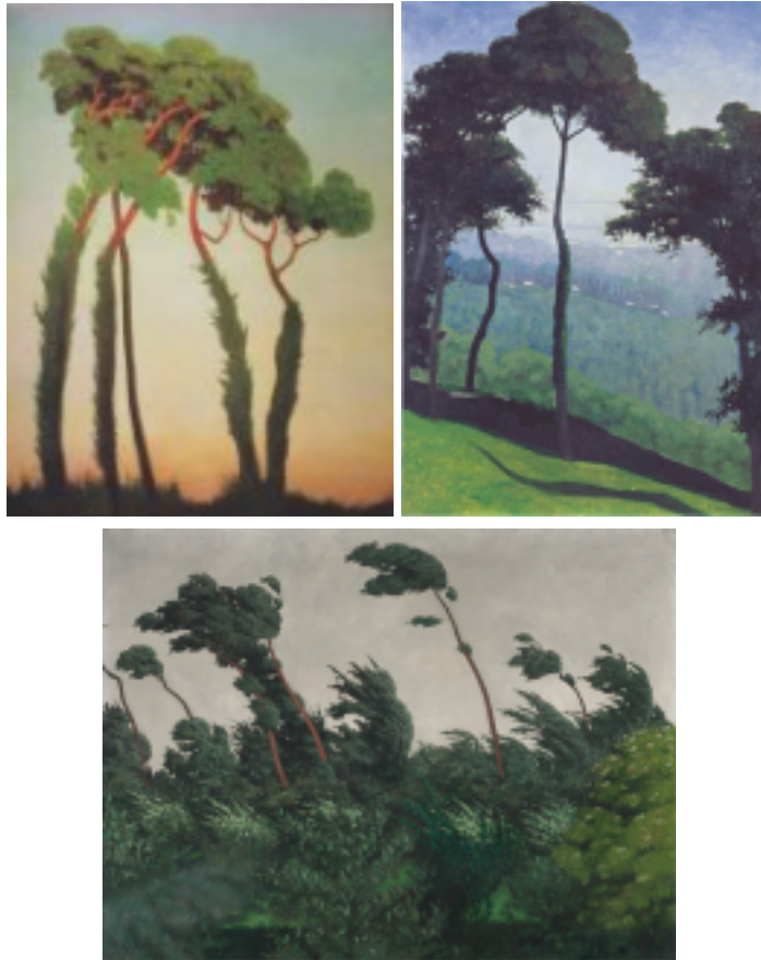
Last sunrays (1911) - View on honfleur (1910) - Le vent (1910)

En concordancia con la ejemplificación propuesta, las características de las diferentes expresiones artísticas nos facilitarán rastrear conclusiones acerca del carácter epocal en que se encuentran insertas. En consecuencia, estos autores se transforman en una vía para que la colectividad tome responsabilidad de su inconsciente. El inconsciente colectivo proporciona a la vida de los pueblos una experiencia que trasciende lo personal; los elementos perdidos surgen como símbolos para impregnarse en la atmósfera espiritual de ese tiempo. Las experiencias artísticas, según sean correcta o incorrectamente comprendidas, tienen efectos muy diversos sobre su evolución ulterior. No depende únicamente de que el artista logre rescatar de lo inconsciente esa imagen arquetípica, sino también de que la masa pueda resolverla colectivamente.