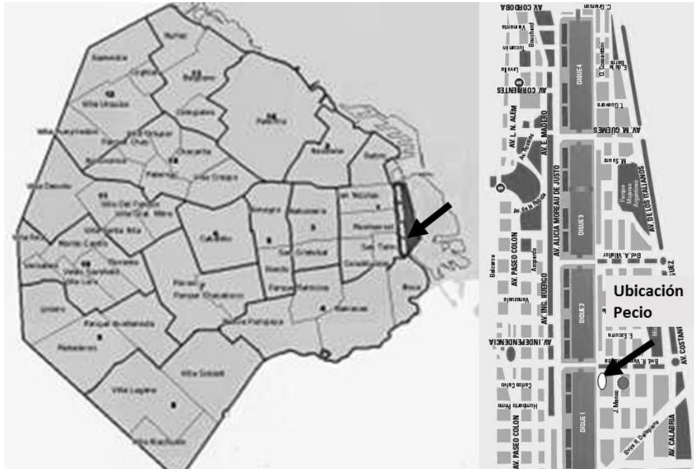
Figura 1. Ubicación del Pecio en el mapa de la Ciudad Autónoma de Buenos Aires. ( www.buenosaires54.com/espanol/puertomadero.htm y www.buenosaireshabitat.com )

Los restos descubiertos pertenecen a un barco de aproximadamente 30 metros de eslora (28 m) 3 , con una bodega que ocupa toda la extensión bajo cubierta, para un óptimo aprovechamiento de su capacidad de carga. La madera de roble y las características constructivas nos hablan de un mercante español del S XVIII, construido por un pequeño astillero de la ribera, en la zona del Cantábrico (García Cano 2012).