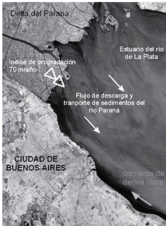
Figura 2. Sentido en que el río Paraná descarga los sedimentos hacia el Estuario del Río de la Plata y vista más detallada del comportamiento del flujo del agua en el estuario (Marcomini y López 2004)

Los sedimentos que llegan al Río de la Plata provienen casi en su totalidad del río Paraná (principalmente Paraná de las Palmas y Paraná Guazú), que descarga sus aguas en forma de un gran delta altamente constructivo, conformando una costa altamente progradante (Iriondo y Scotta, 1978; Marcomini y López, 2004; FREPLATA 2014 y Figura 2). Estudios efectuados durante los últimos 100 años han demostrado que su régimen de flujo es de una gran variabilidad, con una componente cuasi-decádica y picos de variabilidad inter-anual en las escalas temporales asociadas al fenómeno de El Niño-Oscilación del Sur (ENOS), esto deriva en periodos de grandes bajas en su altitud intercalados con otros de crecidas de considerable magnitud (Camilioni, 2014; FREPLATA, 2014). La composición sedimentaria nos habla de una historia muy compleja de un sistema que posee, aún al día de hoy, una dinámica muy activa (Iriondo 1985).