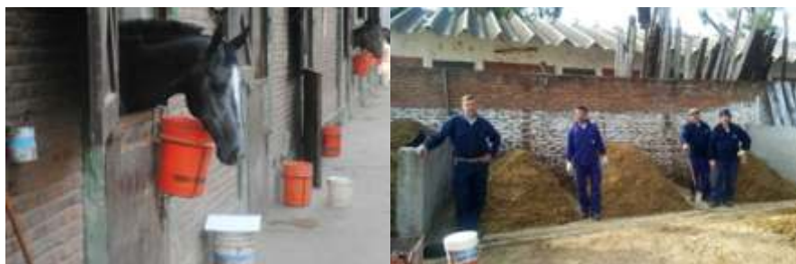
Figura 1: A la izquierda inmediaciones del Hipódromo Independencia. A la derecha personal de trabajo del Hipódromo que colaboró en las tareas de compostaje.

En este caso el residuo a compostar fue el proveniente de la cama de equinos. El objetivo de la Practica Pre-Profesional fue determinar la respuesta del proceso de compostaje aplicado a muestras de residuos de la cama de equinos sometidas a distintos tratamientos, posibilitando además la formación de los estudiantes a cargo.