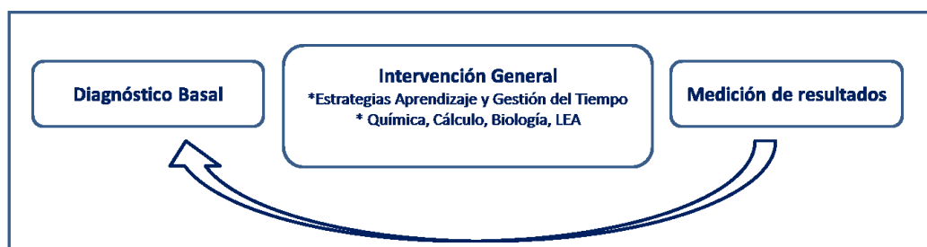
Figura 1: modelo operativo funcionamiento Programas de Acompañamiento CREAR.

Se divide en dos fases principales. El programa de Acompañamiento Inicial, que corresponde a una intervención de carácter intensivo que se desarrolla a nivel nacional durante las dos semanas previas al ingreso formal de los estudiantes a clases y considera un curso disciplinar de Química, Cálculo, Biología o Lectura y Escritura Académica, vinculado a un curso de Estrategias de Estudio y Aprendizaje. Luego, durante el año académico, se desarrolla el Programa de Acompañamiento Continuo que considera la realización de Tutorías Académicas de Pares (TAP) destinadas a ejercitar semanalmente los contenidos de los cursos disciplinares y además la realización de Acompañamiento Psicoeducacional, que corresponde a un coaching académico personalizado, desarrollado por los profesionales del Instituto. Hasta el año 2014, 7.322 estudiantes de la Universidad San Sebastián han sido acompañados académicamente a través de estos Programas. Desde una perspectiva operativa, el Programa de Acompañamiento se desarrolla de acuerdo a un modelo general de intervenciones implementadas por CREAR. Esto considera una evaluación basal determinada por el Instrumento ICAI y evaluaciones disciplinares realizadas a los estudiantes al ingreso. Luego, se realiza la intervención general que considera el desarrollo de los cursos disciplinares en vinculación al curso de Estrategias de Aprendizaje y posteriormente se miden los resultados que servirán también como una forma de retroalimentar el proceso (figura 1).