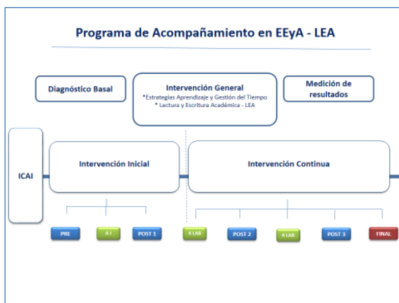
Figura 3: modelo de trabajo Programa de Acompañamiento en Lectura y Escritura Académica y Estrategias de Estudio y Aprendizaje.

A partir de lo anteriormente señalado, es posible visibilizar cómo el Programa contempla por un lado los Componentes Cognitivos, Motivacionales y Demográficos del estudiante [13], que se trabajan desde las Estrategias de Estudio y Aprendizaje , y por otro, las principales fases de Lectura y Escritura Epistémica propuesta desde la Alfabetización Académica [12] [11], que se trabajan en los cursos de Lectura y Escritura Académica . Ambas intervenciones se sitúan dentro de un contenido disciplinar específico perteneciente a un curso de primer año de los estudiantes (figura 3).