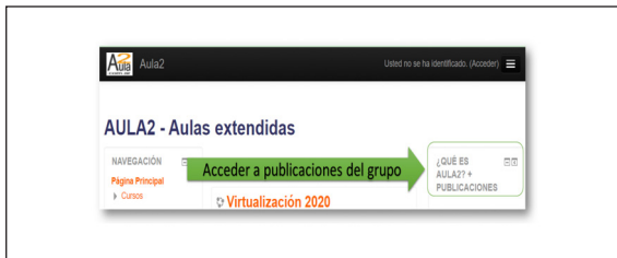
Figura 1. Acceso a publicaciones del grupo en Aula2

Las primeras investigaciones eran básicas, sin aplicación alguna en forma directa, se proponían construir conocimiento sobre los procesos sociocognitivos en entornos virtuales cuando estos se combinaban con las aulas tradicionales o, como se lo conoce habitualmente, blended learning . En un espacio al que llamamos Aula2 – Aulas extendidas (imagen en Figura 1), abierto a diferentes comunidades educativas, aprendimos a administrar Moodle, socializamos con docentes de distintas carreras de grado y posgrado y presentamos nuestras publicaciones.