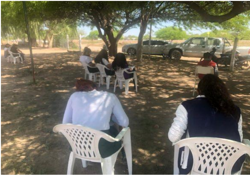
Estudiantes de 2º año en una clase al aire libre

Las fotos se presentan aquí como una camada adicional de información y significado: dan validez y profundidad a la construcción del conocimiento y que en el campo el salón de clase no es el lugar privilegiado para construir el conocimiento.