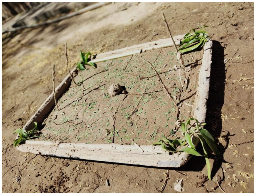
Patio de juegos con una pequeña cancha de futbol construida con barro

La foto que sigue demuestra cómo y de qué forma el medio rural puede ser percibido igualmente como portador de “soluciones”, un lugar positivo para alternativas para la falta de recursos vía la creatividad de los niños y por reproducir las fisuras e jerarquías sociales constituidas en relación a este espacio tan diferenciado de los grandes centros: pero no mucho!.