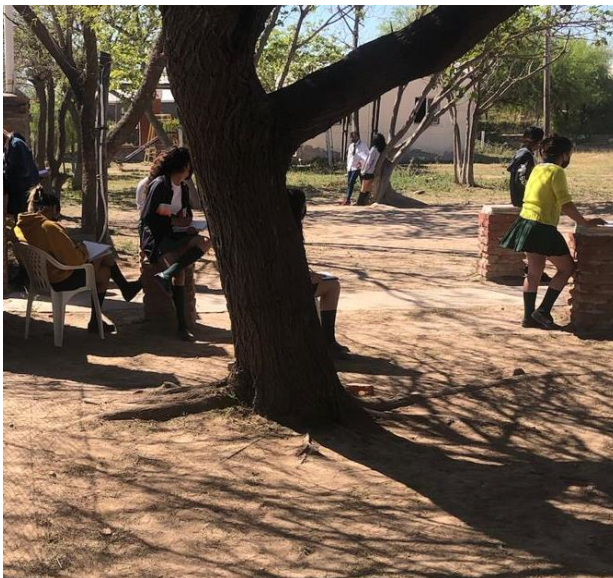
Estudiantes en el recreo

Modos de trabajar diferenciado en función de variables locales (grandes espacios verdes, número manejable de estudiantes por clase, posibilidad de clases multiseriadas, etc.)