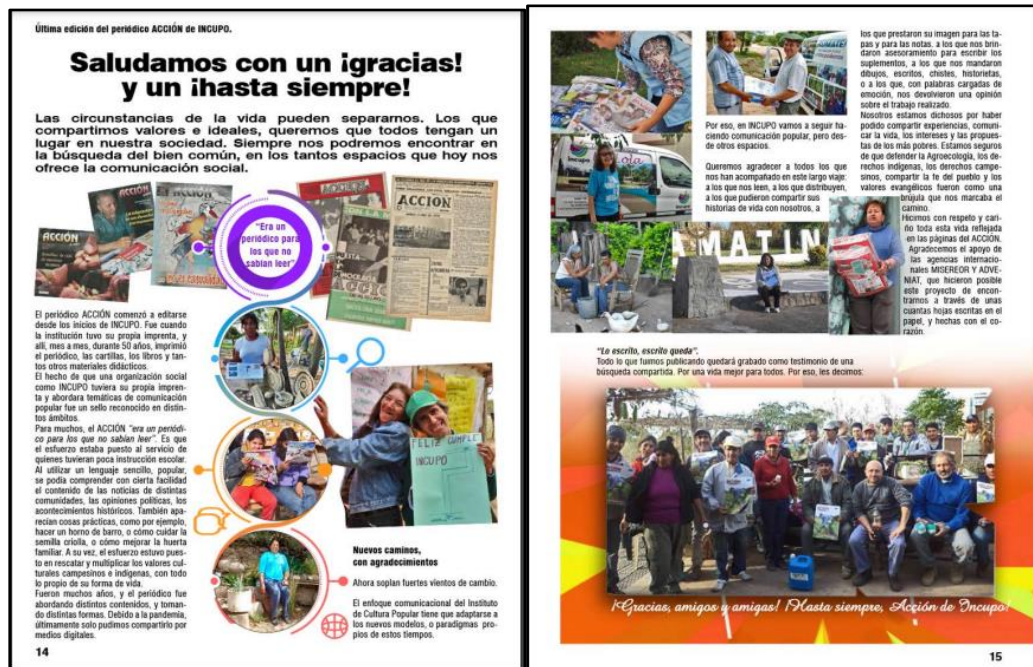
Figuras 18 y 19: Artículo de despedida del último Periódico Acción editado de forma digital Año XLVII, N° 521

Para muchos el Acción era un periódico para los que no sabían leer. Es que el esfuerzo estaba puesto al servicio de quienes tuvieran poca instrucción escolar. Al utilizar un lenguaje sencillo, popular, se podía comprender con cierta facilidad el contenido de las noticias de las distintas comunidades, las opiniones políticas, los acontecimientos históricos. También aparecían cosas prácticas, como, por ejemplo, hacer un horno de barro, o cómo cuidar la semilla criolla, o cómo mejorar la huerta familiar. A su vez, el esfuerzo estuvo puesto en rescatar y multiplicar los valores culturales campesinos e indígenas, con todo lo propio de su forma de vida (Periódico Acción, 2020).