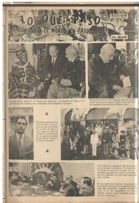
Figura 9 (izquierda arriba): “Norte, información regional” Periódico Acción. Año II, N°18.