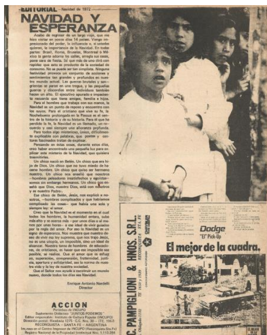
Figuras 15 y 16: Acción Navidad 1972, año II, N° 23., tapa y editorial.

La búsqueda de participación de “colaboradores/vendedores populares” se planteó como una estrategia a implementar desde INCUPO. Se trataba de “instituciones intermedias”, las que “ayudan a contactarnos con posibles vendedores del ACCIÓN. Son instituciones que conocen los objetivos de ACCIÓN y nos ayudan a llegar a los más pobres del campo. La mayoría de los intermediarios son religiosas y párrocos católicos” 73 , como también integrantes de organizaciones sociales y asociaciones civiles que focalizan en la educación popular, la defensa del medio ambiente y de los pequeños productores agropecuarios. INCUPO les otorgaba a los vendedores populares el 40% del costo de la publicación como compensación por sus servicios de venta. Asimismo, para garantizar que estos vendedores llegaran a los sectores más desfavorecidos de las zonas rurales y de los pueblos, se llevaba a cabo un proceso de capacitación.