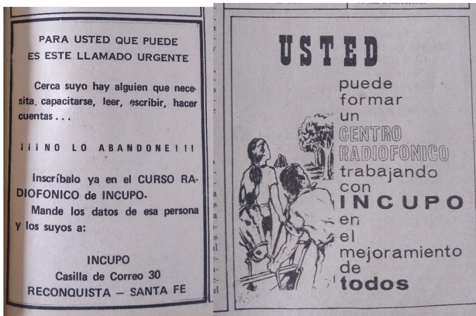
Figuras 3 y 4: Recuadros del Periódico Acción sobre los Centros Radiofónicos

Desde las páginas de las ediciones del Periódico Acción, hacían referencia a los Centros Radiofónicos convocando a formar uno en la región en que se encuentre el lector (Figura 3), invitar a personas que necesiten alfabetizarse (Figura 4).