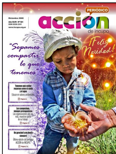
Figuras 17: Portada del último Periódico Acción editado de forma digital Año XLVII, N° 521

De esta manera, llegado diciembre del año 2020, la última edición del Periódico Acción se realizó en formato digital. Esto traía consigo muchos límites.