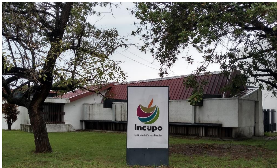
Figura 2: Frente de las oficinas de INCUPPO en Reconquista

dinámicas.” 12 En este sentido, “INCUPPO no puede abarcar toda la problemática que hay en una comunidad pero sí lo hacía en articulación con otras instituciones.” 13