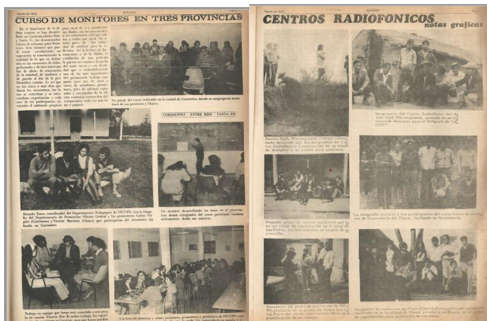
Figura 5 y 6: Curso de monitores en tres provincias y Centros Radiofónicos. Acción. Año II, N°18, 1972.

En las páginas del Periódico Acción se muestran los trabajos que INCUPO realizaba, sobre todo los de capacitación, cursos de monitores e imágenes de los centros radiofónicos (figuras 5 y 6).