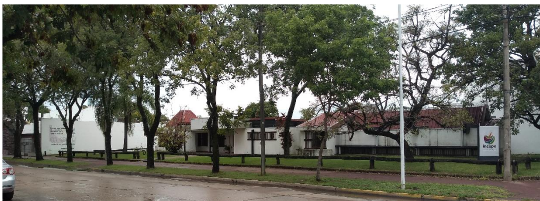
Figura 1: Frente de las oficinas de INCUPO en Reconquista

INCUPO surge en 1969 en el norte de Santa Fe, en la ciudad de Reconquista. Allí se encuentra la oficina central y el centro de capacitación (Figura 1 y 2). Luego se fue expandiendo hacia Formosa, Chaco, Corrientes, Misiones, Entre Ríos, Santiago del Estero, Tucumán, Catamarca, La Rioja, Jujuy y Salta. En los comienzos tenían diferenciadas dos grandes regiones, el noreste (NEA) y el noroeste argentino (NOA). Actualmente el área de incidencia de INCUPO es Santiago del Estero en el NOA y el norte de Santa Fe, Formosa, Chaco y Corrientes en el NEA: