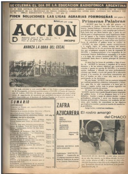
Figura 7 (izquierda): Primera plana del Periódico Acción. Año II, N°18.

El periódico se sumó a la numeración de los boletines y surgió desde el Año II y con el número 18, iniciando con una edición de 26 páginas, en dos secciones, una dedicada a los aspectos periodísticos, y otra a los didácticos correspondientes al suplemento Juntos Podemos.