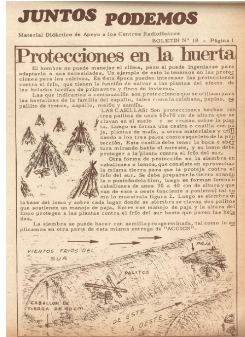
Figura 8 (derecha): Suplemento Juntos Podemos. Año II, N°18