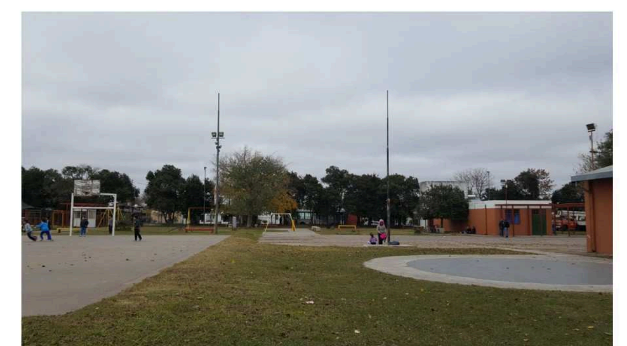
El Centro Polideportivo Cristalera