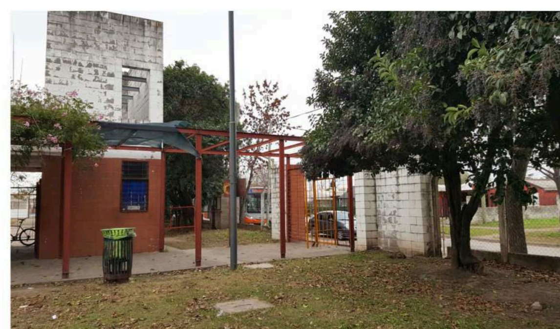
Espacio público: área verde en intersección de calles N° 1310 y Polledo