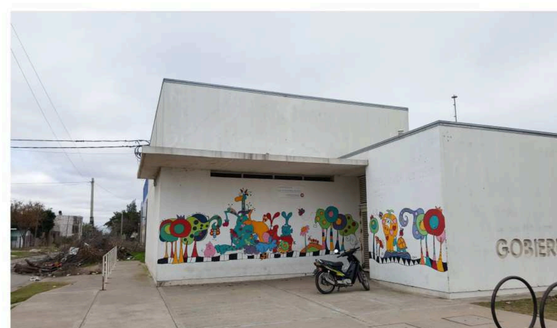
El Centro de Salud