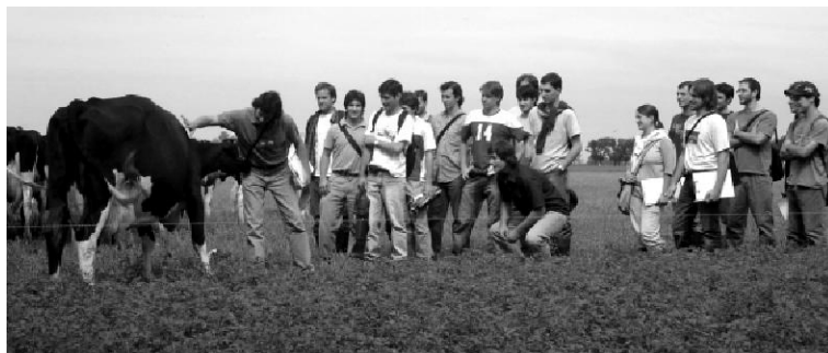
Foto 2: Alumnos del último año de Agronomía en un práctico de Producción Animal.

o perfeccionamiento para productores, técnicos, tamberos y estudiantes avanzados, sobre temas específicos. Mucha de la información producida también se difunde en charlas organizadas por otras instituciones.