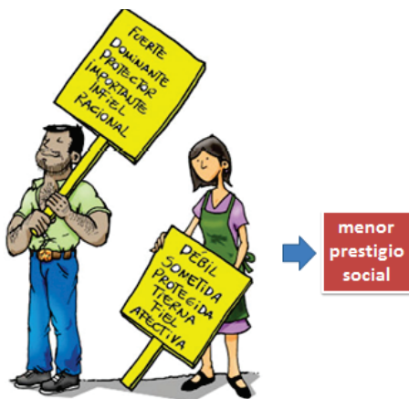
Figura 2: Estereotipos