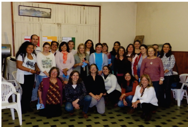
Figura 3. Participantes del tercer taller realizado en la SFR de Salto

organizaciones y las capacidades de sus integrantes. Se trianguló información primaria y secundaria recabada por los equipos técnicos durante los talleres, con información primaria proveniente de once entrevistas semi-estructuradas a informantes calificados/as de diferentes perfiles.