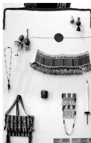
Figura 5. Artefactos visuales indígenas, Dja Guata Porã Río de Janeiro indígena , Río de Janeiro, 2017.