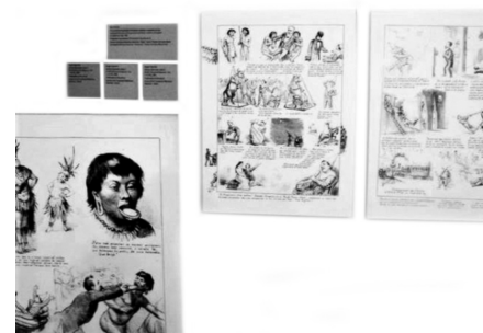
Figura 3. Ilustraciones de Angelo Agostini (detalle), Dja Guata Porã: Río de Janeiro indígena , Río de Janeiro, 2017.