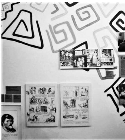
Figura 4. Ilustraciones de Angelo Agostini (detalle), Dja Guata Porã: Río de Janeiro indígena , Río de Janeiro, 2017.