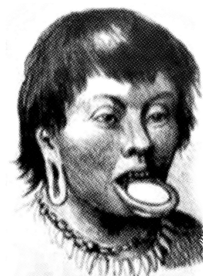
Figura 1. Ilustraciones de Angelo Agostini (detalle), Dja Guata Porã: Río de Janeiro indígena , Río de Janeiro, 2017.