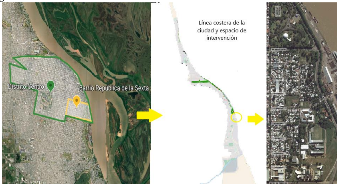
Figura N° 1: Ubicación del barrio en el trazado urbano.