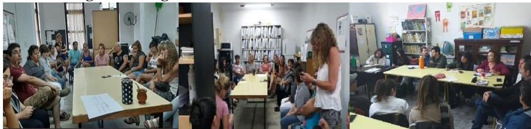
Figura N° 11: Registros fotográficos Mesas de Gestión Barrial