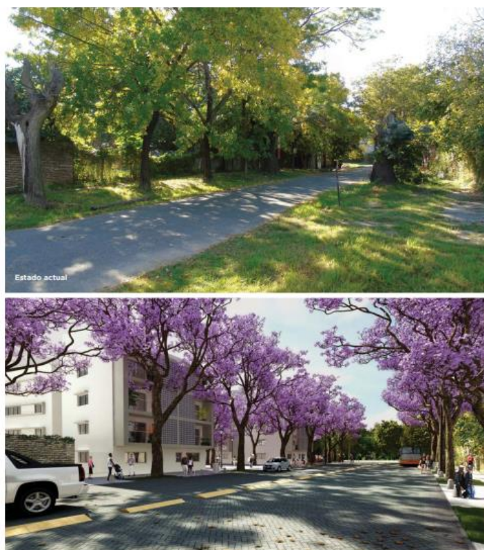
Figura N° 5: Planificación de calle Viamonte