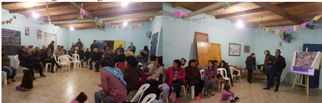
Figura N° 12: Registros fotográficos asambleas barriales