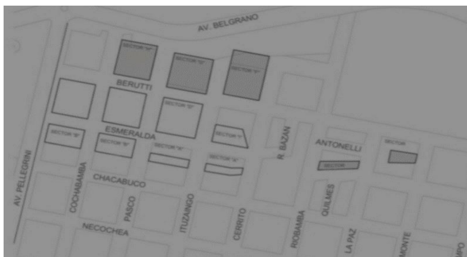
Figura N° 2: Mapa sectores relevados por Abre Familia en agosto de 2018