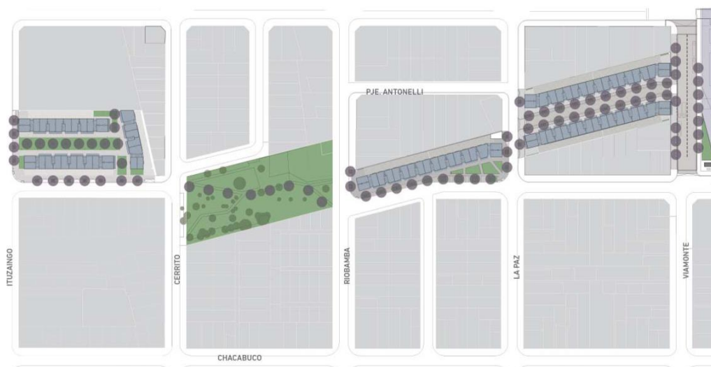
Figura N° 6: Localización de complejos de viviendas