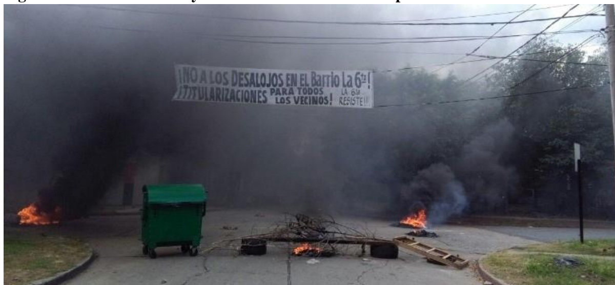
Figura N°8: Corte de calle y manifestación en Barrio República de la Sexta 61

Las situaciones descriptas relatan el inicio los conflictos entre los actores involucrados. Estas disputas tienen su fundamento en la tensión originada en torno a la posesión de las tierras, las competencias legales asociadas a la misma y el uso del espacio. En este plano, se generó un importante escenario de desacuerdo y antagonismo entre los gestores del proyecto, (principalmente organismos municipales, la UNR) con los habitantes afectados y las organizaciones barriales 60 (presuntos beneficiarios de la política).