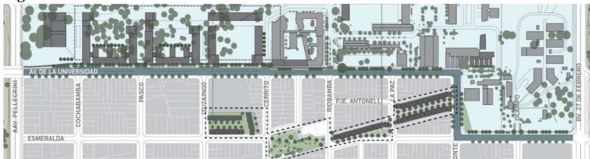
Figura N° 4: Trazado Av. De la Universidad