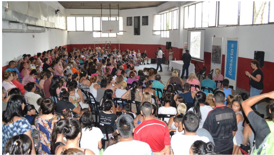
Figura N°10: Primera asamblea que realiza la Secretaría de Hábitat de Rosario en el barrio