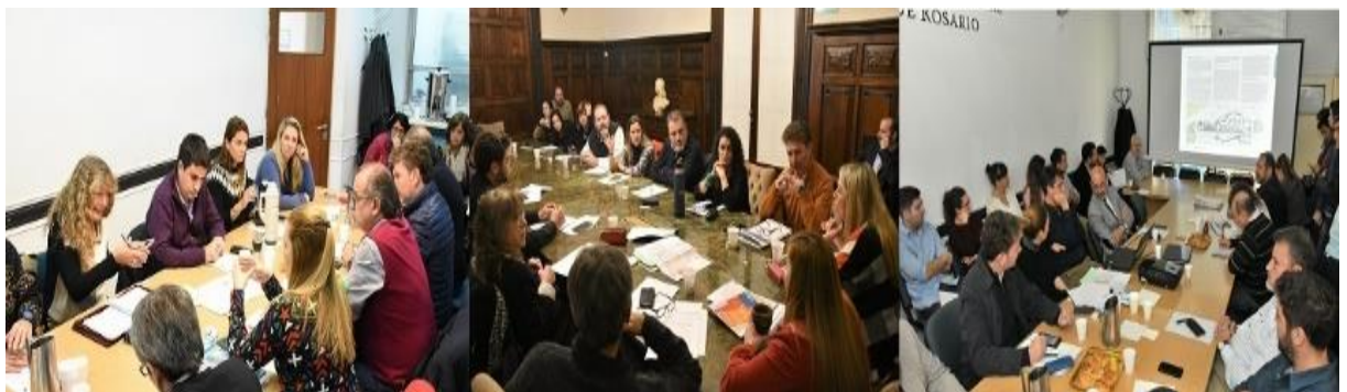
Figura N°9: Presentación y tratamiento del proyecto por parte de las comisiones del Concejo de Rosario 67