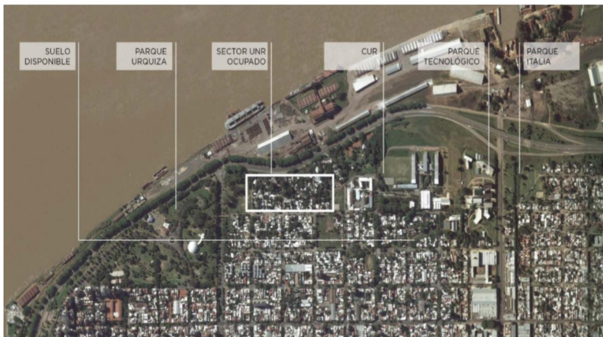
Figura N° 3: Mapa del barrio y CUR

En base a la información brindada por el sitio web de la Municipalidad de Rosario y según informes de los proyectos antes mencionados, el territorio a intervenir cuenta con una población de alrededor de 5.000 habitantes –en la zona afectada y alrededores próximos- y su realización beneficiará a más de 40.000 estudiantes 39 . En relación a las familias afectadas por el proceso, serían reubicadas dentro del mismo barrio en las nuevas viviendas proyectadas en terrenos cercanos. Además, las iniciativas habitacionales contemplan la ejecución de 321 unidades para, aproximadamente, 1.444 beneficiarios directos. La inversión es de $1.000.000.000 (mil millones de pesos) y los fondos son provistos por el gobierno provincial 40 .