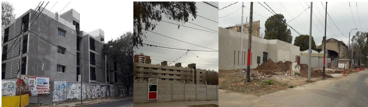
Figura N° 13: Registro fotográfico del avance de obras del complejo de vivienda y de Av. De la Universidad Año 2020 77