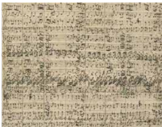
Fig. 3. Partitura de Johann Sebastian Bach

La misma fotografía (Figura 2) puede usarse para ilustrar cruces espaciotemporales en la iconicidad (ver también Elleström 2013): un representamen bidimensional y estático representa un objeto temporal tridimensional. Como es probable que la persona en el mundo representado de la fotografía no se entienda como rodeada de gotas de agua planas e inmóviles, es casi inevitable añadir una tercera dimensión espacial y temporal. A pesar de su restringida bidimensionalidad, la fotografía se asemeja a la escena de un mundo tetradiimensional (cf. Benovsky 2012). Una partitura musical de Johann Sebastian Bach (Figura 3) podría servir como otro ejemplo de iconicidad espaciotemporal cruzada, aunque se ve claramente que, en parte, funciona con la ayuda de símbolos: es un representamen bidimensional y estático que representa un objeto temporal, la música (que sin duda también tiene ciertas cualidades espaciales tridimensionales). Asimismo, una representación espacial bidimensional pero intemporal, como un diagrama gráfico, puede representar un fenómeno temporal como el aumento de la temperatura global en la atmósfera.