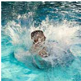
Fig. 2. Fotografía de una persona en el agua

La misma fotografía (Figura 2) puede usarse para ilustrar cruces espaciotemporales en la iconicidad (ver también Elleström 2013): un representamen bidimensional y estático representa un objeto temporal tridimensional. Como es probable que la persona en el mundo representado de la fotografía no se entienda como rodeada de gotas de agua planas e inmóviles, es casi inevitable añadir una tercera dimensión espacial y temporal. A pesar de su restringida bidimensionalidad, la fotografía se asemeja a la escena de un mundo tetradiimensional (cf. Benovsky 2012). Una partitura musical de Johann Sebastian Bach (Figura 3) podría servir como otro ejemplo de iconicidad espaciotemporal cruzada, aunque se ve claramente que, en parte, funciona con la ayuda de símbolos: es un representamen bidimensional y estático que representa un objeto temporal, la música (que sin duda también tiene ciertas cualidades espaciales tridimensionales). Asimismo, una representación espacial bidimensional pero intemporal, como un diagrama gráfico, puede representar un fenómeno temporal como el aumento de la temperatura global en la atmósfera.