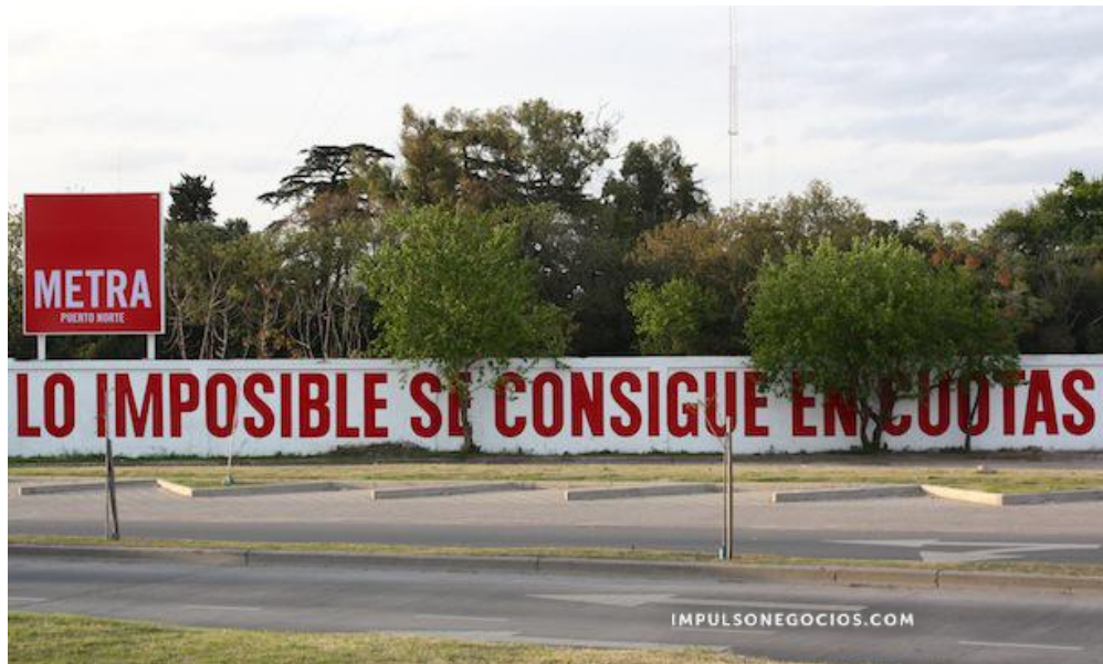
Figura 1. Imagen del slogan publicitario de la empresa de desarrollos inmobiliarios TGLT. (2017)

Quien ha emprendido también una caracterización del capitalismo ha sido Benjamin (1985), acercando la idea del capitalismo como una religión, metáfora a través de la cual resalta sus rasgos de culto permanente, sin tregua, que a la vez sería profundamente culpabilizante y no expiante, en oposición a los sistemas religiosos tradicionales. Hoy en día vemos a esta culpa expandirse y persistir, hasta llegar a un estado mundial de desesperación. Hablamos además que es un culto que rendimos a un Dios que debe permanecer oculto. Al retomar este aporte, Kelman (2015) plantea que el corazón de la formulación del capitalismo como religión de Benjamin, se sostiene en la operación que coloca en el vacío de lo sagrado un rasgo escrito Schuld .