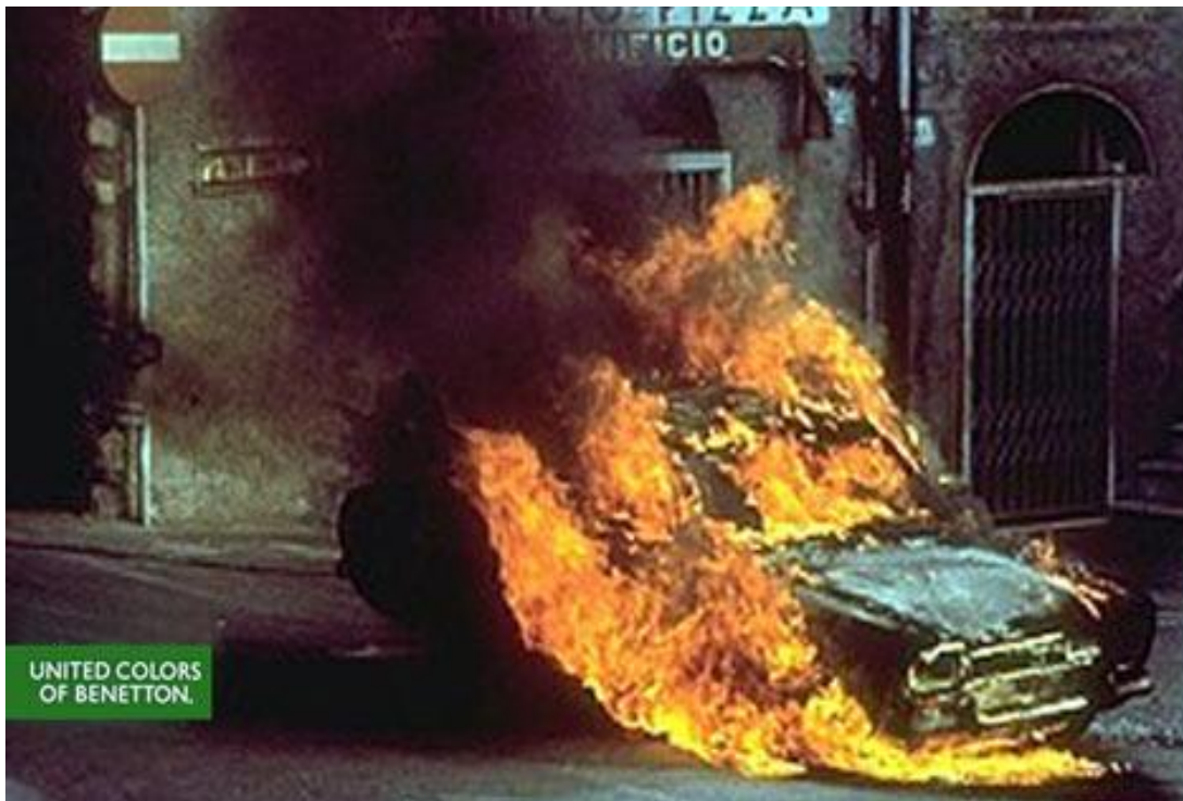
Figura 3. Imagen publicitaria de Benetton en la que se muestra a un auto consumido por el fuego. (Toscani, 1991b)

No sería entonces ningún gran cambio, aunque ésta pueda parecer una modalidad publicitaria sumamente innovadora y con un mensaje conmovedor, sino que hacer ingresar estas imágenes escalofriantes dentro de una de las estrategias más comunes del marketing como es la publicidad. Queda demostrado, una vez más, que nada de lo humano parece lograr escapar al cálculo capitalista. La relación con el vacío y la apariencia no es tratada ya a través de la promoción de los ideales, sino en términos que podrían explicitarse así: “No hay más que este horror que te mostramos, así que vístete con Benetton, ya que sólo quedará tu apariencia” (Aleman, 1993, p.52). Estamos, otra vez, en el adormecimiento.