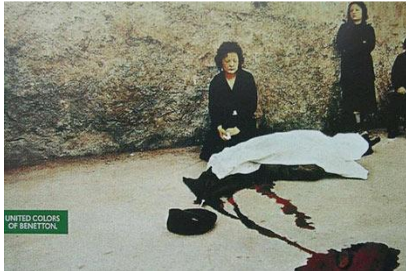
Figura 4. Imagen publicitaria de Benetton en la que se muestra el cadáver de una persona recientemente asesinada. (Toscani, 1992a)