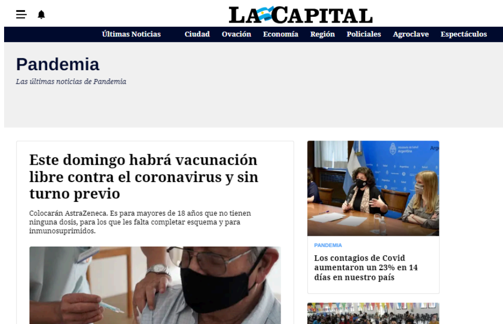
Figura 5: captura de pantalla de la sección “Pandemia” en la actualidad de la web del diario La Capital