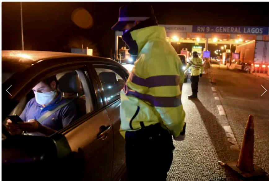
Figura 4: captura de pantalla de una recopilación de imágenes tomadas por La Capital durante los primeros meses de la pandemia.

Con respecto a la fotografía, surgieron dos alternativas durante la pandemia. En primer lugar, cuando volvió el fútbol a las canchas, la Asociación de Reporteros Gráficos de Argentina