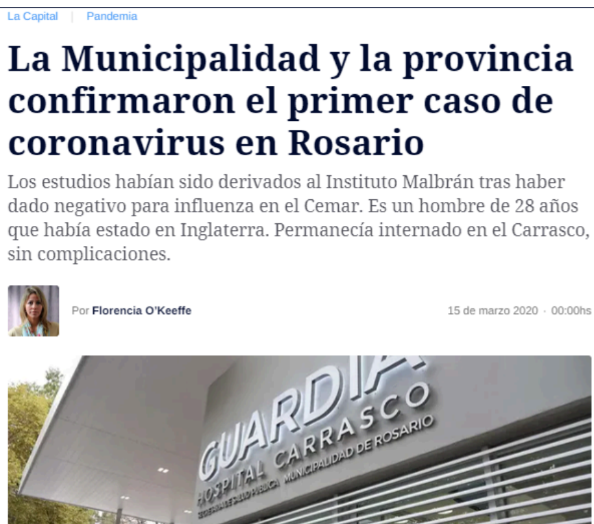
Figura 3: Captura de pantalla de la nota publicada en La Capital sobre el primer caso de Covid registrado en la ciudad de Rosario

Cuando el gobierno dispuso el comienzo del Aislamiento Social, Preventivo y Obligatorio, a partir del 20 de marzo de 2020, los trabajadores de La Capital se vieron en una situación muy particular que obligó a la empresa a proveer respuestas y soluciones de manera muy rápida. Más allá de la disposición del Ejecutivo Nacional de aislar a las personas que se consideraban población de riesgo frente al virus, la capacidad física de la redacción no era suficiente para poder cumplir con las medidas de distanciamiento. Entonces, lo primero fue decidir quiénes irían a trabajar en forma presencial a la redacción y quiénes se quedarían en sus hogares, y adaptar el espacio a las necesidades de cuidado del personal. Quienes sufrían de alguna condición de salud que pusiera en riesgo sus vidas o las de sus familiares ante un posible contagio fueron alertados y aconsejados por sus médicos a quedarse en sus casas. Mientras esto se debatía entre los encargados, hubo un periodo de aproximadamente tres semanas en el que todo el personal trabajó desde la casa.