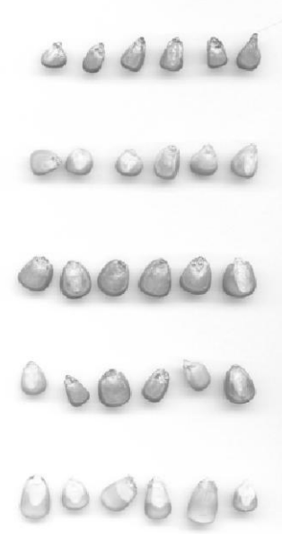
Foto 3: Diferentes tipos de semillas ensayadas. Obsérvese la variabilidad en el tamaño y forma de las semillas