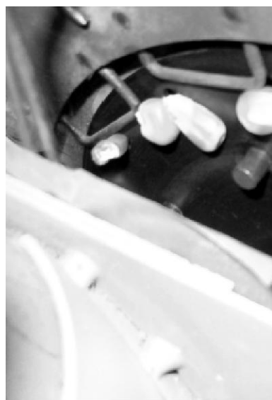
Foto 1: Placa del Servidor Neumático que entrega las semillas a la placa horizontal del sistema dosificador mecánico tradicional.

El dispositivo se presenta como un elemento aplicable a las sembradoras en uso que, dotadas de dosificadores mecánicos, podrían ser equipadas con este aditamento para aumentar la eficiencia en el manejo de las semillas desuniformes