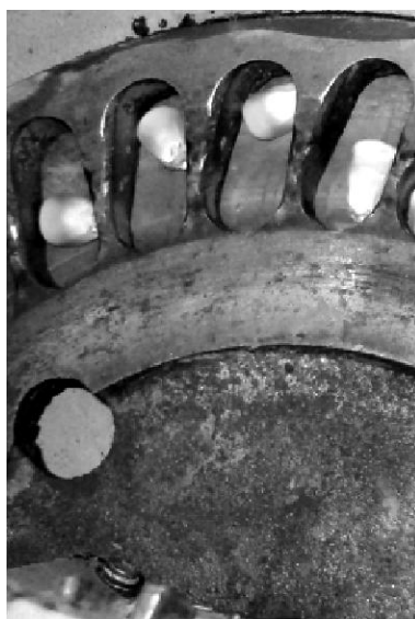
Foto 2: Placa ranurada del dosificador mecánico que receptiona las semillas que entrega el servidor neumático.

neumáticos. De esta manera, y de acuerdo a lo sugerido por el fabricante, el dispositivo sería un accesorio de fácil instalación que permitiría seguir utilizando el sistema mecánico típico, de placas perforadas, sin necesidad de someter a desgastes al sistema neumático durante la siembra de otras especies, siendo aplicado únicamente para las siembras monograno de alta precisión (caso maíz).