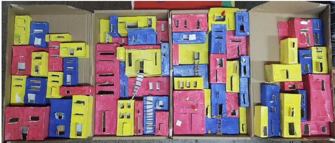
Imagen 17. “Casa de Pájaros de Colores” tríptico con cajas de cartón. Año 2019