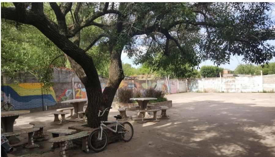
Imagen 15. Espacios que comparte el nivel primario con el nivel inicial con actividades lúdico-pedagógicas y recreativas. Año 2019