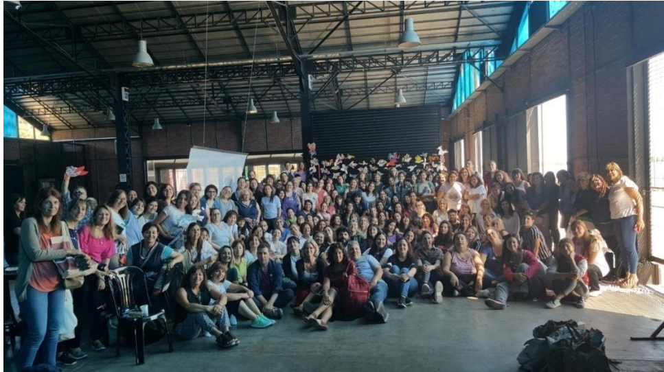
Imagen 13. Grupo de docentes de artes visuales de la región VI. 5 de Diciembre 2019.

Como cierre se proyectan stop motion realizados en los CNP de la región VI, esta técnica de animación, se propone como recurso que permite a los niños la utilización de las nuevas tecnologías como medio de expresión artística. La convocatoria es diseñada para de manera conjunta (Supervisores, y docentes de artes visuales) pensar, construir y fortalecer de manera comprometida la enseñanza de la educación artística