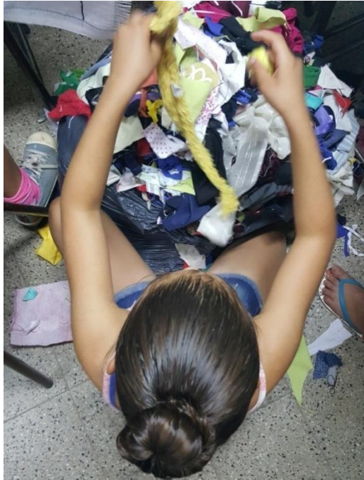
Imagen 22. Selección de telas para el mural. Año 2019