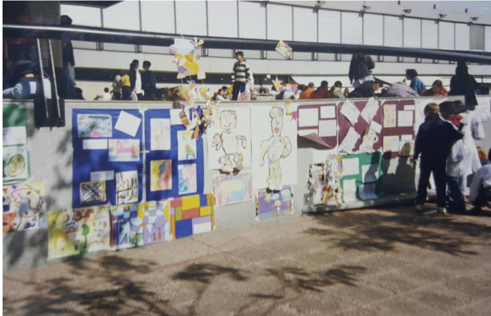
Imagen 7. Exposición de trabajos 1º encuentro de CNP. En la plaza Fontanarrosa. Año 2000

Los dos días de jornada, convoco un centenar de niños, niñas, docentes del área artística como así también directivos quienes participaron de las actividades planificadas ocupando los espacios de la peatonal San Martín y la Plaza Montenegro.