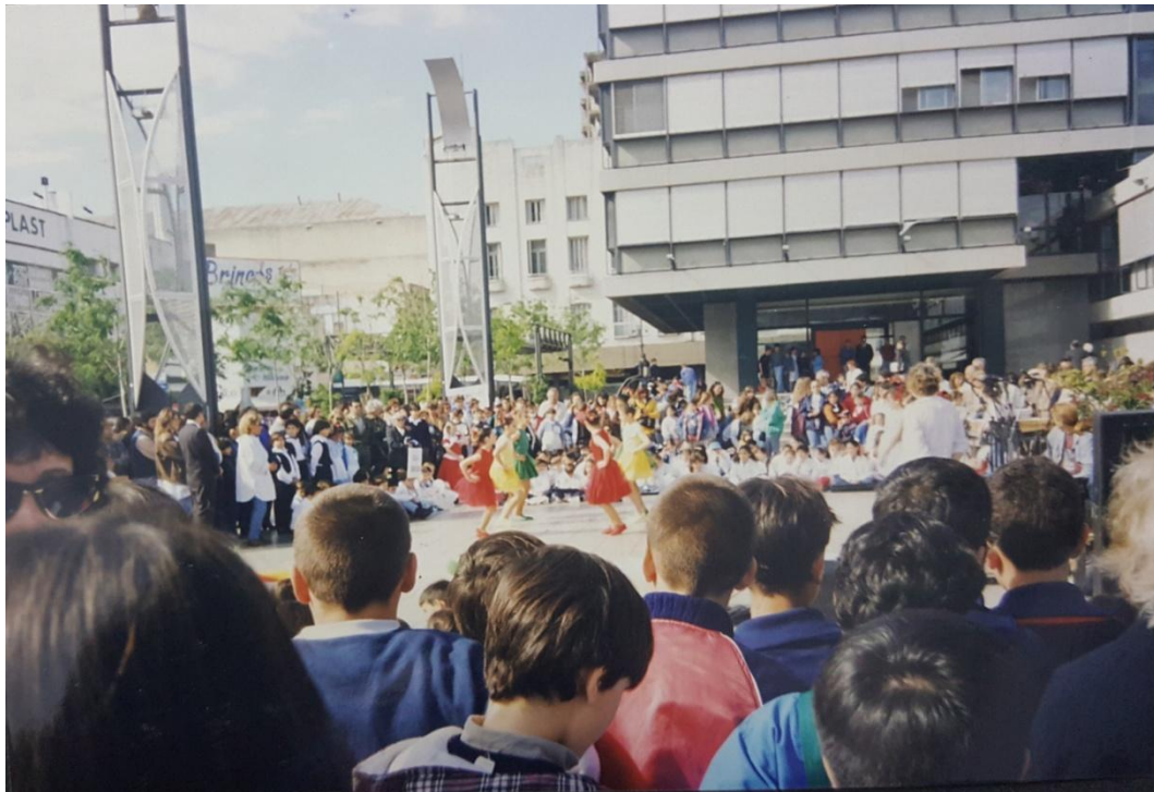
Imagen 4. Alumnos realizando danzas en el 1º encuentro de CNP. En la plaza Fontanarrosa. Año 2000