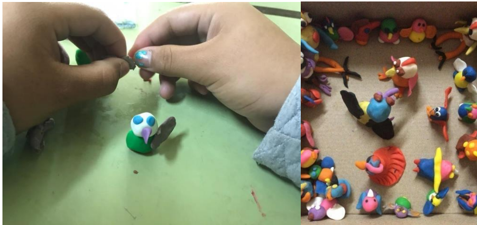
Imagen 18. Modelado de pájaros en plastilina. Año 2019