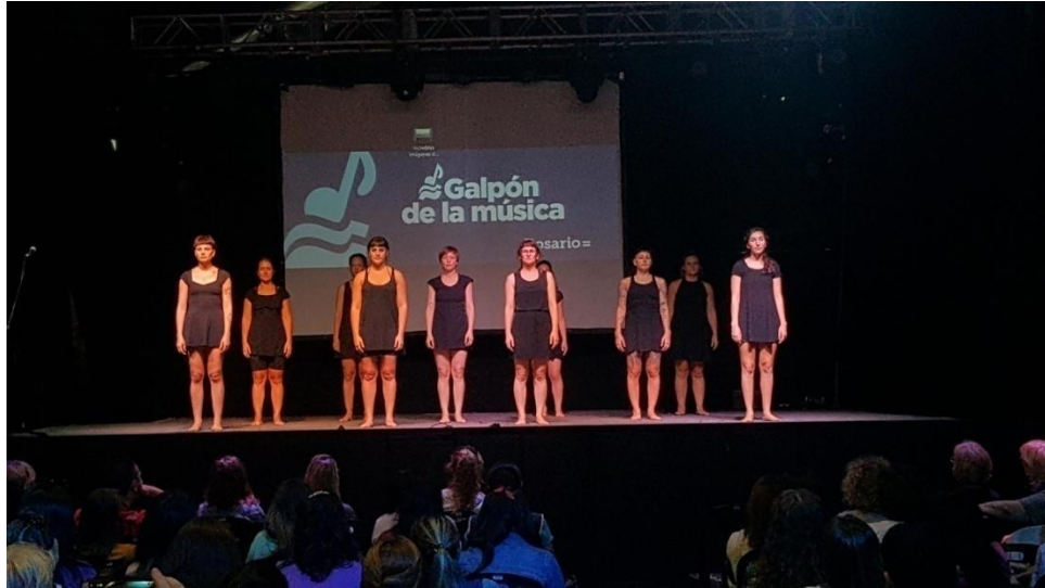
Imagen 10. Grupo de danza. Año 2019

Un grupo de mujeres danzando interpelan dicho acto. Sus cuerpos imitan la gracia y movimiento de las aves. Al finalizar entra en juego la reflexión sobre la práctica docente y se propone una consigna grupal, la confección de un ave a partir de puesta en escena compartida. Un cartón de 20 x 20 cm, los colores, texturas y tamaños son requisitos primordiales para la creación. Como artistas disparadores a la propuesta, se proponen a Isidro Ferrer (España), Pablo Lehman (Argentina), El Anatsui (Ghana), Nelson Ramos (Uruguay). Los docentes se sienten tan estimulados ante la consigna que ponen manos en acción sin recurrir a la consulta de ellos, y haciendo de los materiales una extensión a su expresión.