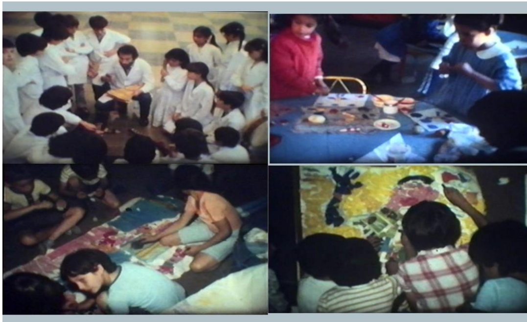
Imagen 26. Otras actividades realizadas a contraturno de Plástica. Año 1981/82. Rosario (Santa Fe).