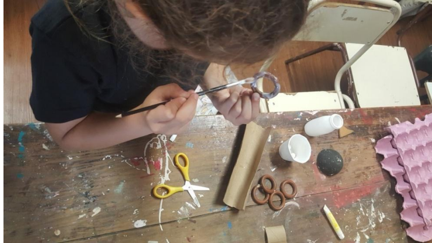
Imagen 31. Alumna trabajando en la propuesta didáctica. Año 2019

Cuando es preciso realizar cortes con cutter (trincheta) los realiza la docente siguiendo las solicitudes de los niños, que además va realizando las indicaciones necesarias durante el proceso del trabajo sobre equilibrio, encastrés o ensamblés.