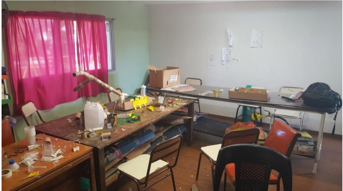
Imagen 30. Salón donde se realizan semanalmente las clases de CNP. Año 2019