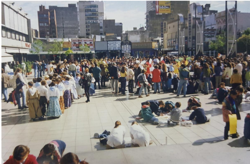
Imagen 6. Alumnos realizando actividades en la plaza Fontanarrosa.