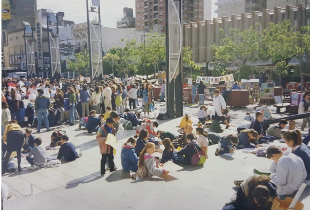
Imagen 3. Alumnos realizando actividades en el 1º encuentro de CNP. En la plaza Fontanarrosa. Año 2000