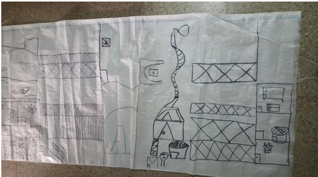
Imagen 21. Confección de mural con fibrones sobre tela. Año 2019

Como siguiente propuesta utilizada tiene como objetivo favorecer la coordinación motora a través del uso de diversos materiales. Se pone en juego también el enriquecimiento del trabajo colaborativo y el fortalecimiento de los vínculos entre sus iguales. Se confecciona un mural en una tela arpillera de rafia de 180 m x 75 cm aproximadamente, en la cual se dibuja con lápiz y posteriormente se remarca con fibrones negros para luego de la selección pegar telas de diferentes colores y tamaños. Durante la acción en sí, los niños vieron la posibilidad de intervenir las telas, utilizando sobre ella crayones (ceritas) y cola vinílica de colores.