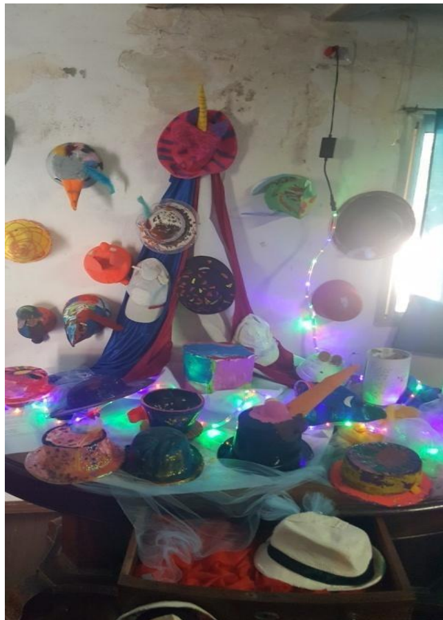
Imagen 37. Trabajos realizados en el CNP. Exposición de fin de año. Año 2019