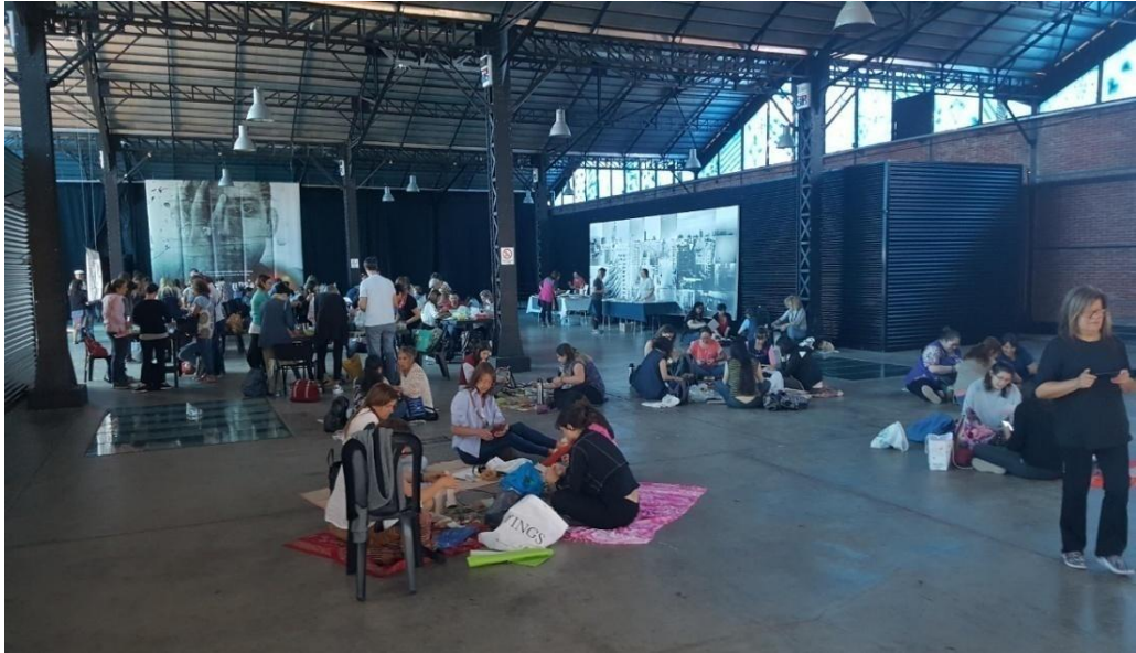
Imagen 11. Docentes esparcidos en el Galpón de la Música Rosario (Santa Fe) elaborando el pájaro. Año 2019