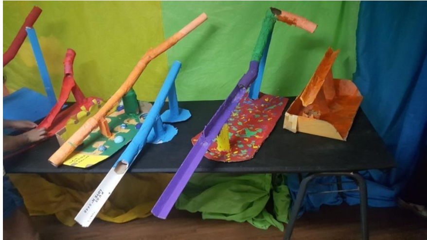
Imagen 36. Circuitos de esferas finalizados. Año 2019