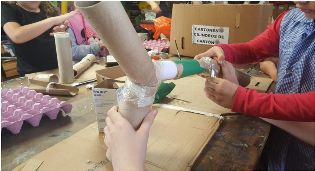
Imagen 33. Circuito tridimensional fijo con objeto (esfera). Foto de autor J.C.G. Año 2019