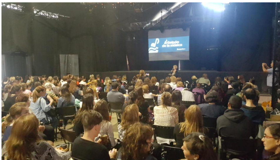
Imagen 8. Docentes convocados de la región VII Apertura del encuentro.

(Provincia de Santa Fe). Foto de Autor J.C.G. Año 2019