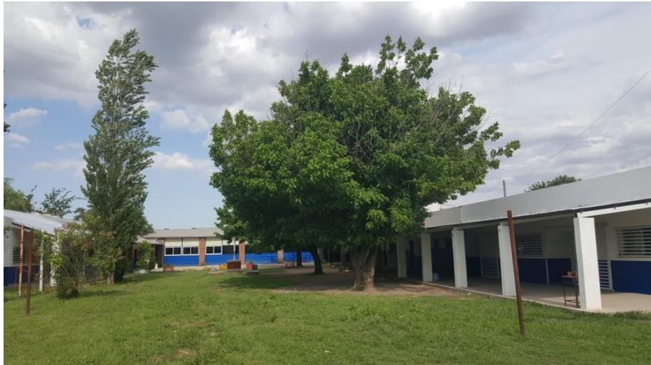
Imagen 14- . Patio de la escuela. Año 2019

En cuanto al espacio donde se desarrolla el CNP, si bien en años anteriores se utilizaba el salón del comedor, actualmente hay un salón de mayor capacidad que se dividió a la mitad, por medio de muebles y armarios. De un lado funciona la biblioteca y el otro es compartido junto con la asignatura Educación Tecnológica. Cuando se coincide con esta materia se utiliza el espacio de la biblioteca.