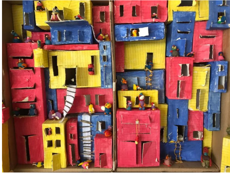
Imagen 19. Detalle del trabajo. Foto A.P. Año 2019