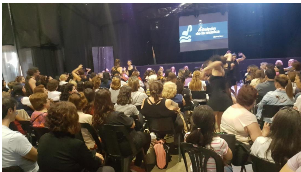
Imagen 9. Docentes convocados de la región VII Apertura del encuentro.

(Provincia de Santa Fe). Foto de Autor J.C.G. Año 2019