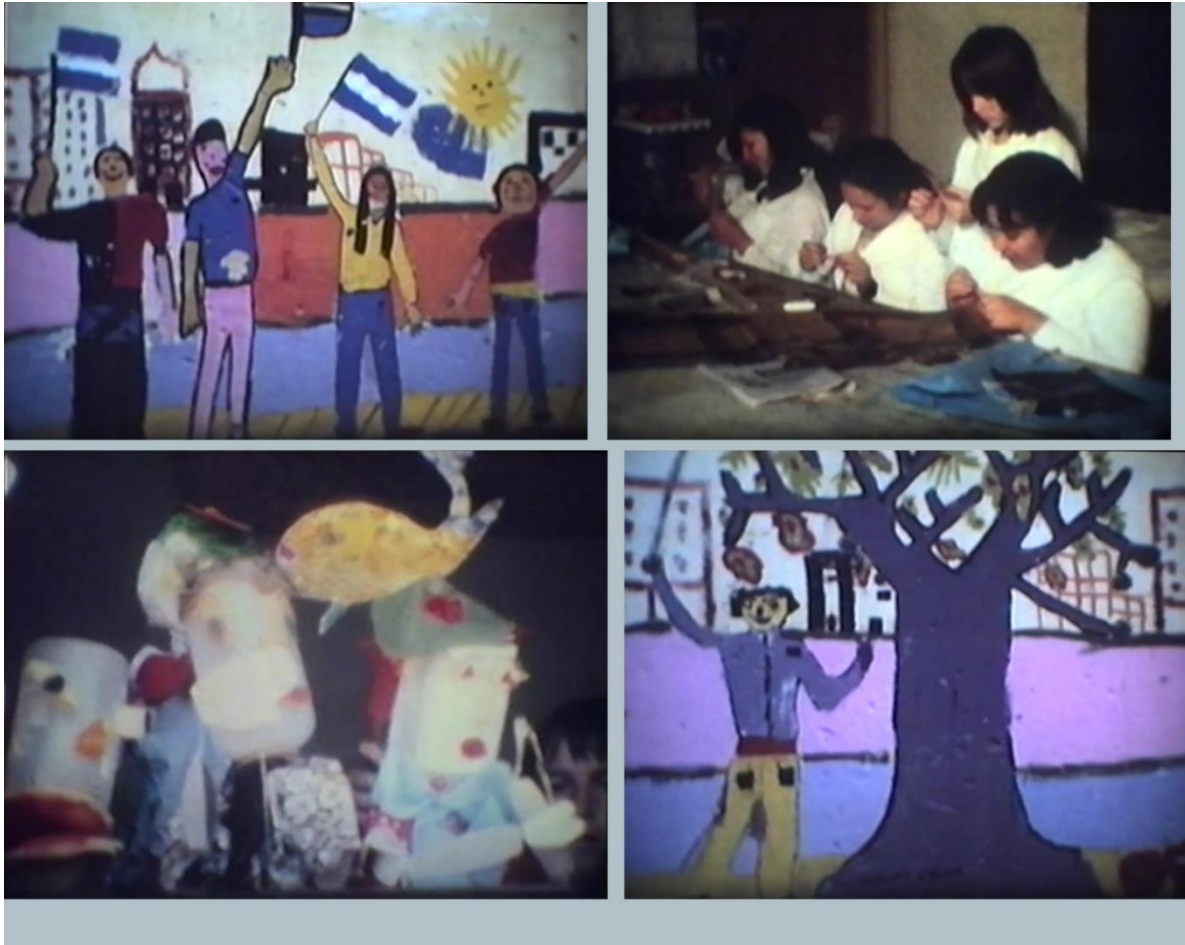
Imagen 25. Actividades realizadas a contraturno de Plástica. Año 1981/82. Rosario