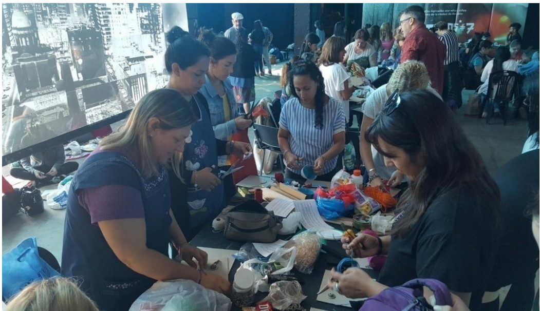
Imagen 12. Docentes creando. Año 2019