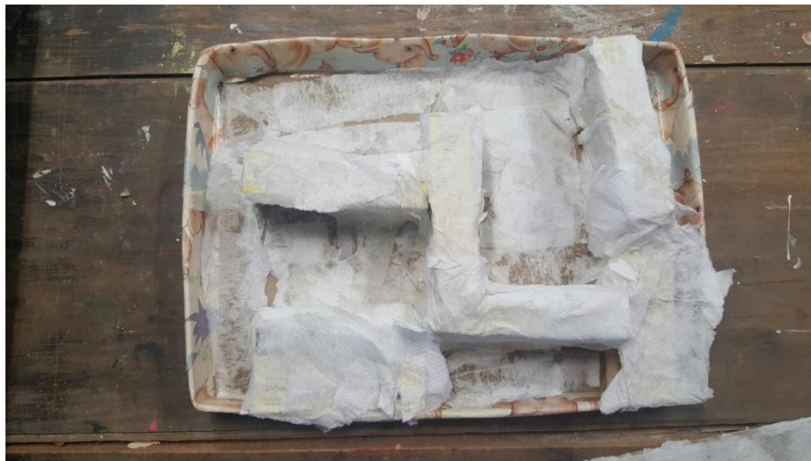
Imagen 34. Circuito tridimensional manipulable con objeto (esfera). Año 2019