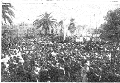
AUTORIDADES, ESCUELAS Y PUEBLO REUNIDOS EN LA PLAZA SAN MARTÍN, EL DÍA 17, MIENTRAS SE RINDE ENTUSIASTA HOMENAJE AL PADRE DE LA PATRIA.

los preclaros varones que hicieron la emancipación y grandeza del país, y cuya fecunda labor nos depurara sabias enseñanzas y ejemplos. Autoridades militares, civiles y eclesiásticas; asociaciones, establecimientos educativos y pueblo, ofrecieron filias en obediencia a la debida transmisión de ideales patrióticos, contribuyendo así a que los actos alcanzaran la debida transcendencia. Sumado a las ceremonias, la presencia de los extranjeros, que querían testimoniar su gratitud a esta tierra de pan llevar, que un día los acogió generosa, cuando en ella buscaron el medio de cultivar sus inquietudes progresistas. Todo ha estado prescrito en la hora tan sensible al sentimiento argentino y a los pueblos que la libertad fue obtenida por la acción genial y valiente del Gran Capitán.