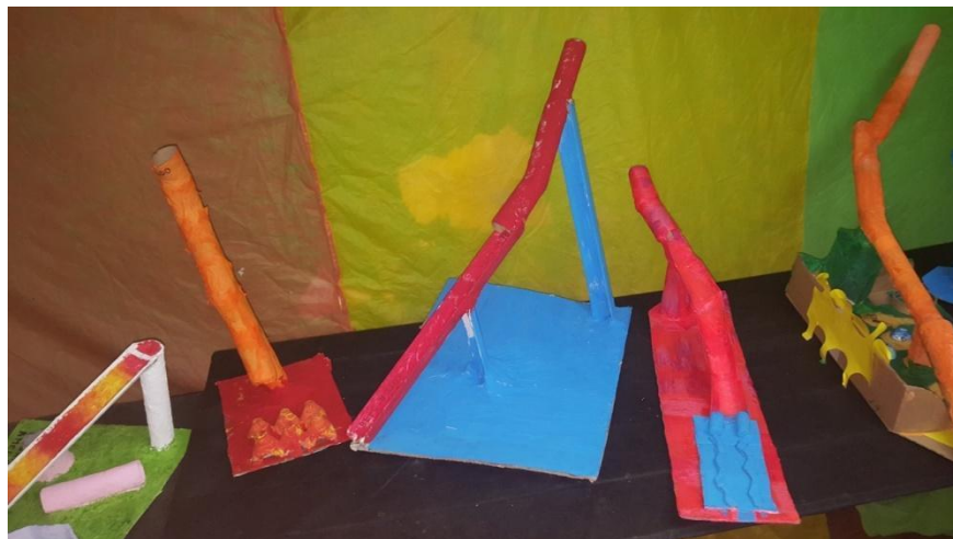
Imagen 35. Circuitos de esferas finalizados. Foto de autor J.C.G. Año 2019

Se pone énfasis en la importancia de lo lúdico y la imaginación, así como en el desafío que implica la incorporación de nuevas técnicas y herramientas. El uso de estas últimas fomenta un constante diálogo e intercambio de experiencias entre los alumnos, enriqueciendo el aprendizaje colectivo y fortaleciendo las dinámicas colaborativas.