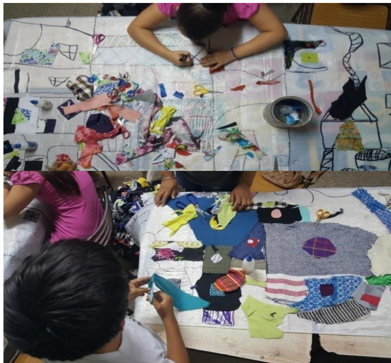
Imagen 23. Proceso y avance del mural. Pegado de telas y pintado con crayones. Año 2019