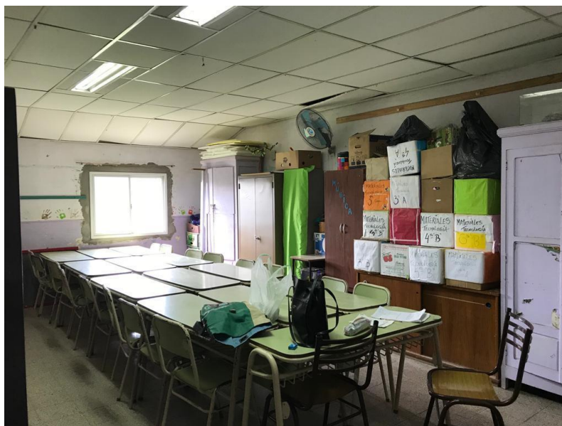
Imagen 16. Salón donde se desarrollan las clases de Club de Niños Pintores (CNP).