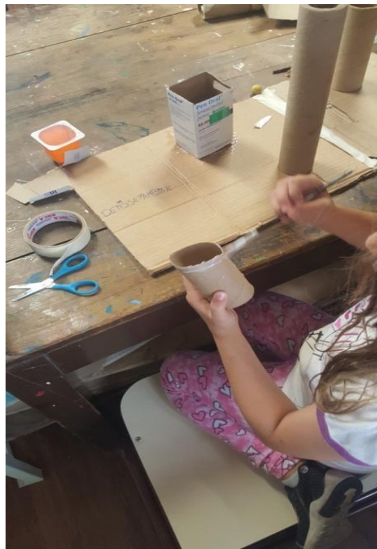
Imagen 32. Encolado de elementos que componen los circuitos. Año 2019