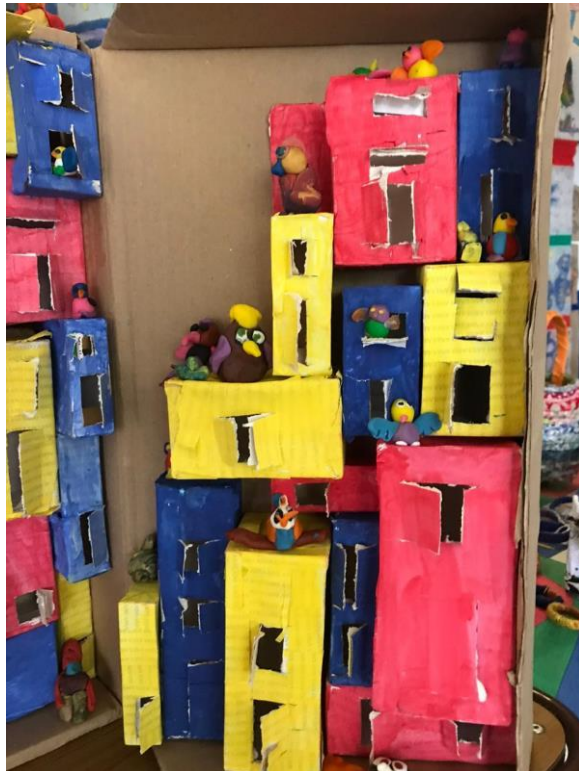
Imagen 20. Trabajo concluido. Año 2019