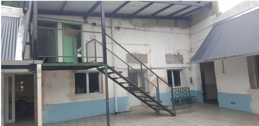
Imagen 28. Exterior del aula de CNP. Foto de autor J.C.G. Año 2019

Para la confección de las actividades del CNP, se tiene en cuenta la diversidad de edades, si ya han asistido el año anterior, o si ya han transitado por otros talleres. A partir de allí se piensan actividades que no hayan sido planteadas en plástica como materia curricular, o por el contrario profundizarlas en caso de ser considerado. Las dinámicas, técnicas y los materiales utilizados se piensan en torno a la posibilidad que el CNP posee una mayor carga horaria que la de la materia plástica, por lo que permite el desarrollo de actividades y uso de materiales que requieren mayor tiempo o espacio acorde a la cantidad de alumnos. Se pone entonces mayor énfasis en la construcción del espacio como contenido a desarrollar.