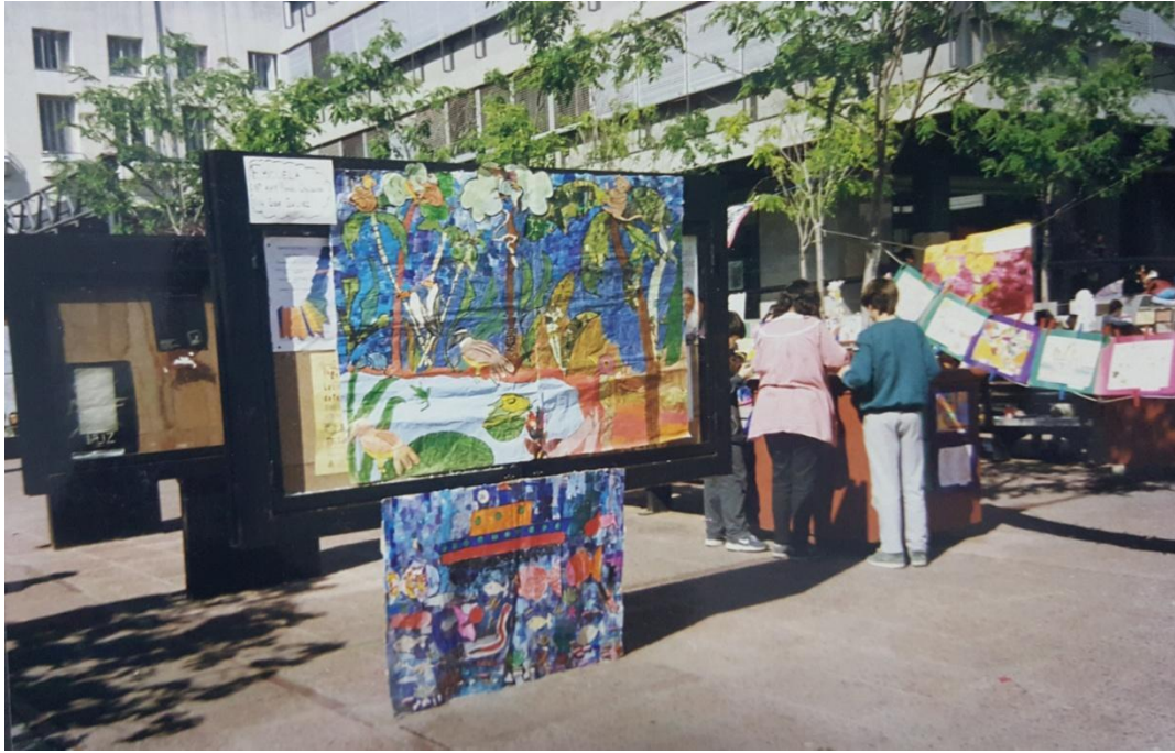
Imagen 5. Alumnos recorriendo muestra de trabajos en el 1º encuentro de CNP. En la plaza Fontanarrosa. Año 2000