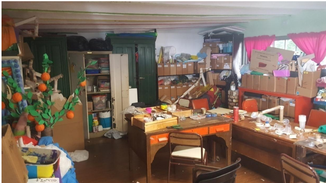
Imagen 29. Materiales y mobiliario utilizados para las clases. Año 2019