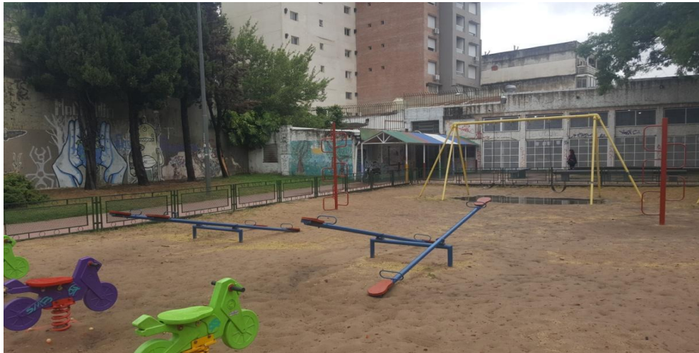
Imagen 27. Frente de la escuela. Año 2019

Dada la diversidad de edades debo planificar en base a las características del grupo. Tengo que evaluar si ya han venido el año anterior (a CNP), si ya han transitado por otros talleres. El primer diagnóstico es fundamental. Tratar de no repetir las actividades planteadas en plástica como materia curricular, o por el contrario profundizarlas si lo creo necesario. Intento que la dinámica, las técnicas y los materiales utilizados sean aquellos que, por una cuestión de falta de tiempo, generalmente, o la gran cantidad de alumnos, no pueda desarrollarse en la materia plástica. Trato de que realicemos más trabajos en el espacio que en el plano. Estoy abierta a las propuestas institucionales que puedan articular con este bello espacio.