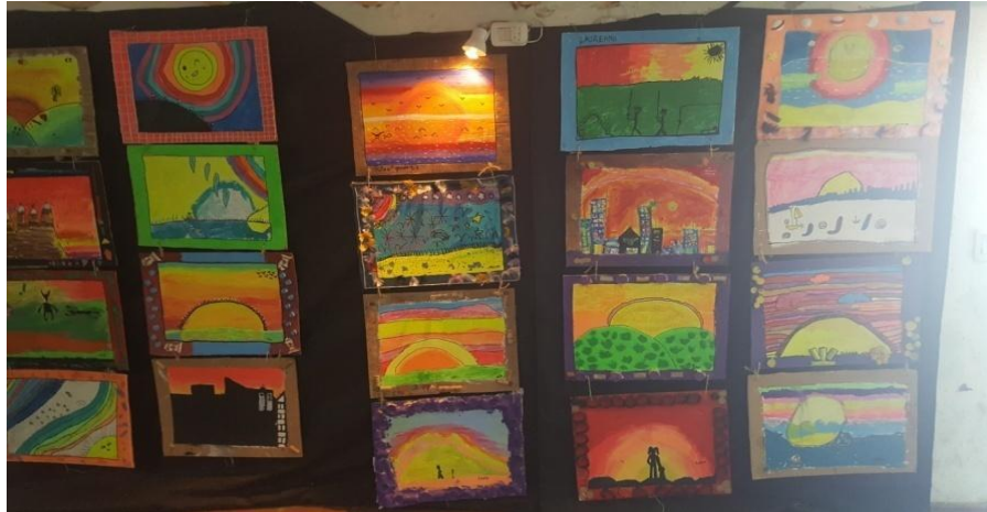
Imagen 38 Trabajos realizados en el CNP. Exposición de fin de año. Año 2019

La diversidad de edades de los integrantes de dicho caso, lleva a la realización de una planificación en torno a ello, como así también la trayectoria de los integrantes dentro de los CNP en años anteriores. Aparece el posicionamiento puesto sobre la no repetir de propuestas temáticas que se hacen en las horas de plástica como materia curricular áulica, estas a veces no son posibles debido a la matrícula de alumnos como así también al espacio, y de hacerlo se profundizan en ellas. Se posibilitan las actividades que involucran contenidos de la “Construcción” (encastre, superposición, plegado, entre otros) los cuales requieren de mayor tiempo.