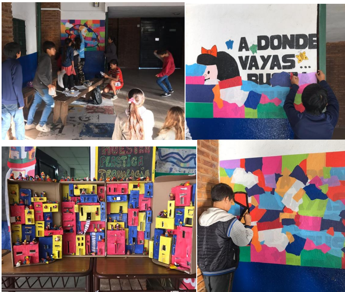
Imagen 24. . Montaje de la muestra del CNP. Foto A.P. 2019

A partir de estos datos, se atestigua que el CNP se genera a partir de proyectos, en este caso involucrando la institución (alumnos, docentes, directivos) y las familias. Tiene por objeto atender las necesidades de los niños y niñas. La escuela entonces, es un lugar donde las experiencias y aprendizajes a través de las artes puedan ser compartidos y visibilizados.