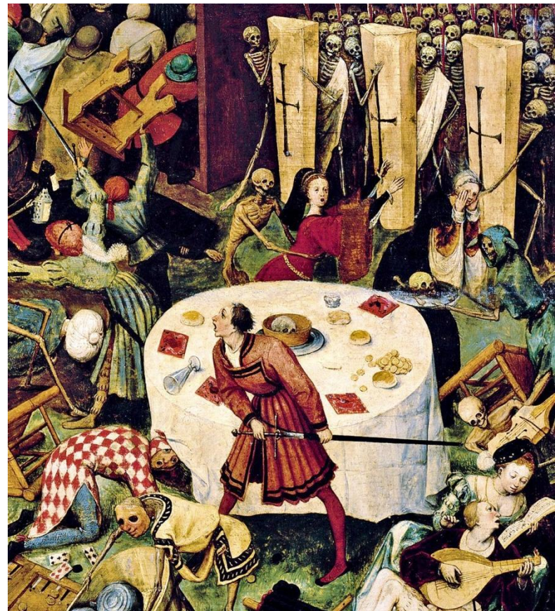
Detalle del óleo "El triunfo de la muerte" (1562), del pintor flamenco Pieter Brueghel el Viejo (Bélgica, 1525 - Bélgica, 1569)