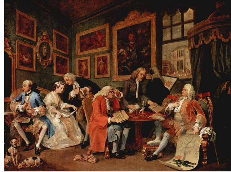
El contrato de boda (1743-1745), de William Hogarth

Ahora el poder podía acumularse en monedas: el dinero era no sólo medio de cambio y de medición del precio de los bienes sino también reserva de valor, y más monedas permitían acumular más valor.