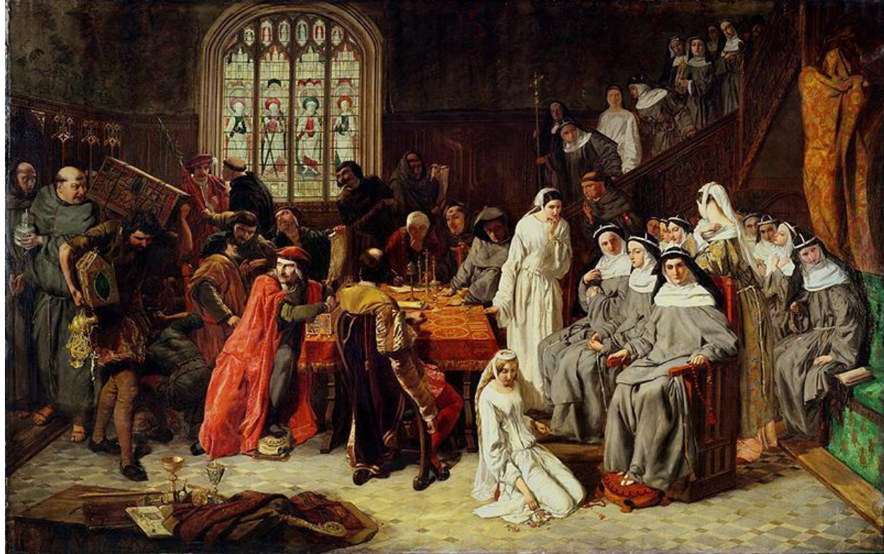
Óleo "Visita y entrega del convento de Syon a los comisionados de 1539", del Artista inglés Paul Falconer Poole (1806-1879)

Además la reforma protestante habilitará al Poder Real británico a expropiar los bienes de la Iglesia y así aumentar exponencialmente con los trabajadores de estos predios, la gran masa de desposeídos del país