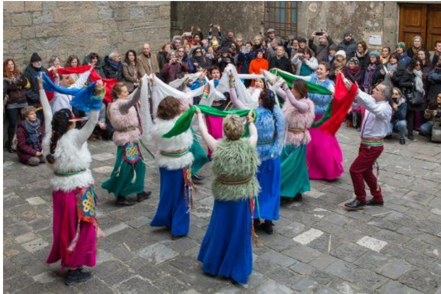
Figura 2. Bailarines de khaita danzando en frente del museo.

Cabe aquí preguntarse acerca del motivo por el cual se propone una espiritualidad globalizada, universalista, desentnazada, desligada de particularidades culturales, lingüísticas y territoriales a través de la CDI, por un lado, y se emplea la FSS para presentar una tradición cultural desligada de lo religioso. Según los propios protagonistas, esta última institución procura llegar a los estudiantes potenciales que, si bien no están buscando específicamente dentro de las alternativas que ofrece el budismo tibetano, quizás se encuentran interesados por los aspectos filosóficos, lingüísticos, históricos o artísticos de la región del Himalaya.