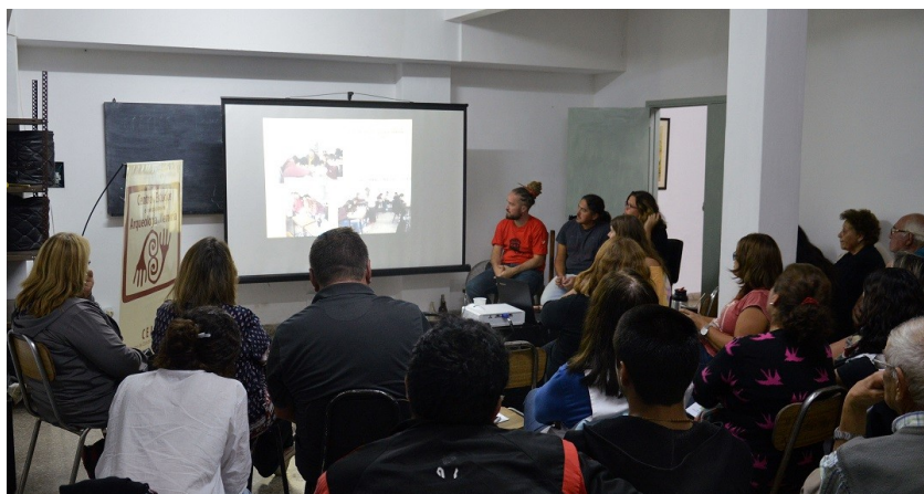
Foto 8: Actividad para finalizar las jornadas de trabajo, compartiendo la intervención. Abril 2017.

manera hubiese caído en el olvido o solo permanecido en el recuerdo de unos pocos.