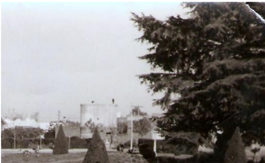
Foto 6: vista de la plaza de la localidad de Hughes, al fondo puede verse el tanque (década del 70).