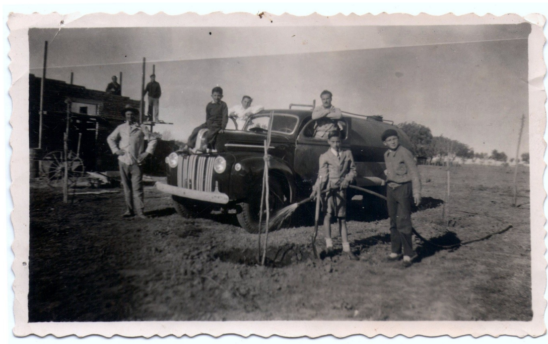
Foto 5: vehículo regador Ford 46, evocado en los relatos, rodeado de niños (1952).

Relatos que también nos acercan esos recuerdos de las mariposas y de los juegos de los niños en ese entonces.