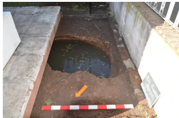
Foto2: Vista del pozo.

Una vez en el lugar, el trabajo de campo consistió en tres líneas de actividades en paralelo. Por un lado, realizamos las tareas arqueológicas y de registro, empleando