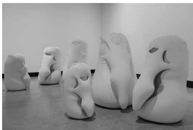
Figura 6. Ernesto Neto «Humanóides», 2001