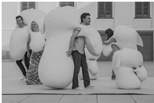
Figura 5. Ernesto Neto «Humanóides», 2001

Dichos emergentes nos permiten avizorar una atmósfera mestiza de incertidumbre, juego, nostalgia y perplejidad que acechaba a la Argentina en aquella década, y que se condensaba en estos cuerpos de materialidad frágil, conducente a la erosión, al desgaste, a la pérdida o hacia la posibilidad de evadirse hacia otros mundos posibles.