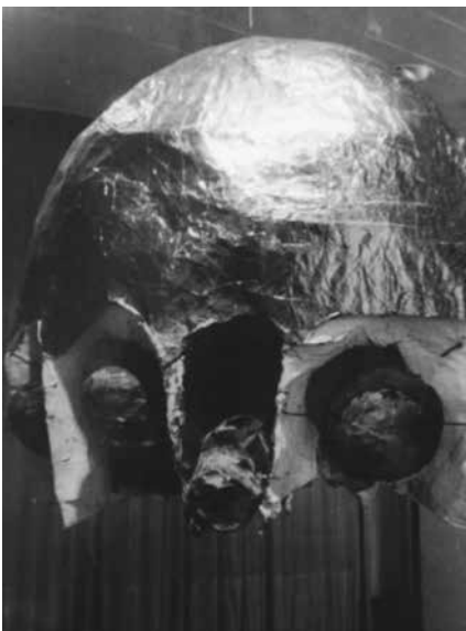
Figura 2. Rubén Santantonín «Aéreo», 1964