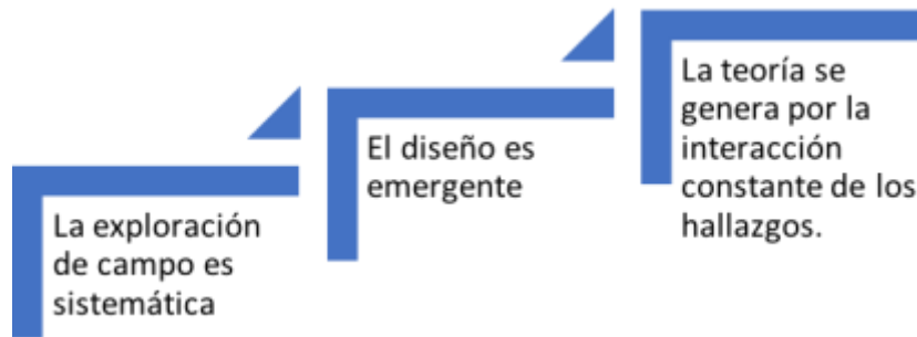
Gráfico 2. Implicaciones en el estudio de caso