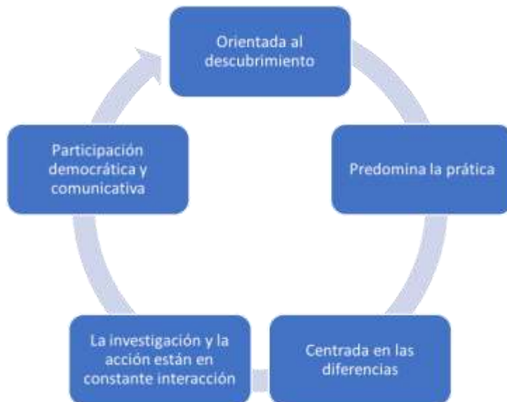
Gráfico3. Características del Paradigma interpretativo

A continuación, se describen algunas características que son fundamentales en el paradigma interpretativo: