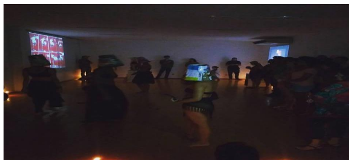
Figura 2. Registro de performance ABAJUR COR DE CARNE em Mostra de Arte feminista FEMMEXISTER, Aliança Francesa de vitória. Fonte: Caio Louback (2016).

Em seguida, tecendo as contribuições de partilha, ABAJUR fora potencializado a formatos colaborativos e coletivos de experimentação, desta vez com a presença e co-autoria de colegas do curso de Ciências Sociais.