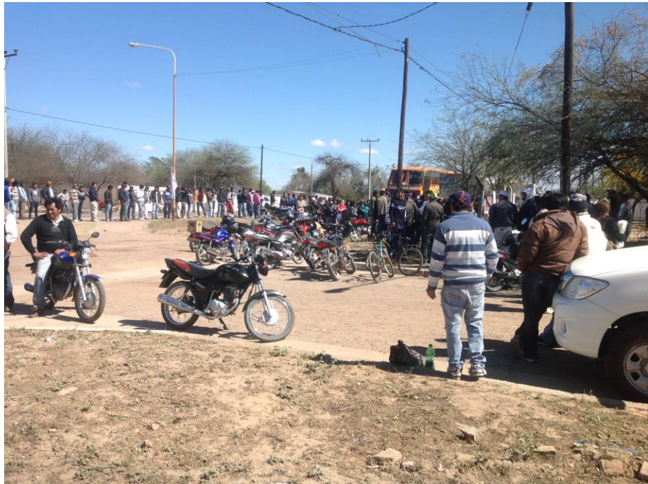
Figura 4: Primera jornada de vacunación con Candid#1 de trabajadores migrantes estacionales, Santiago del Estero, 2014.