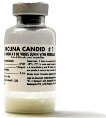
Figura 3: Vacuna Candid#1