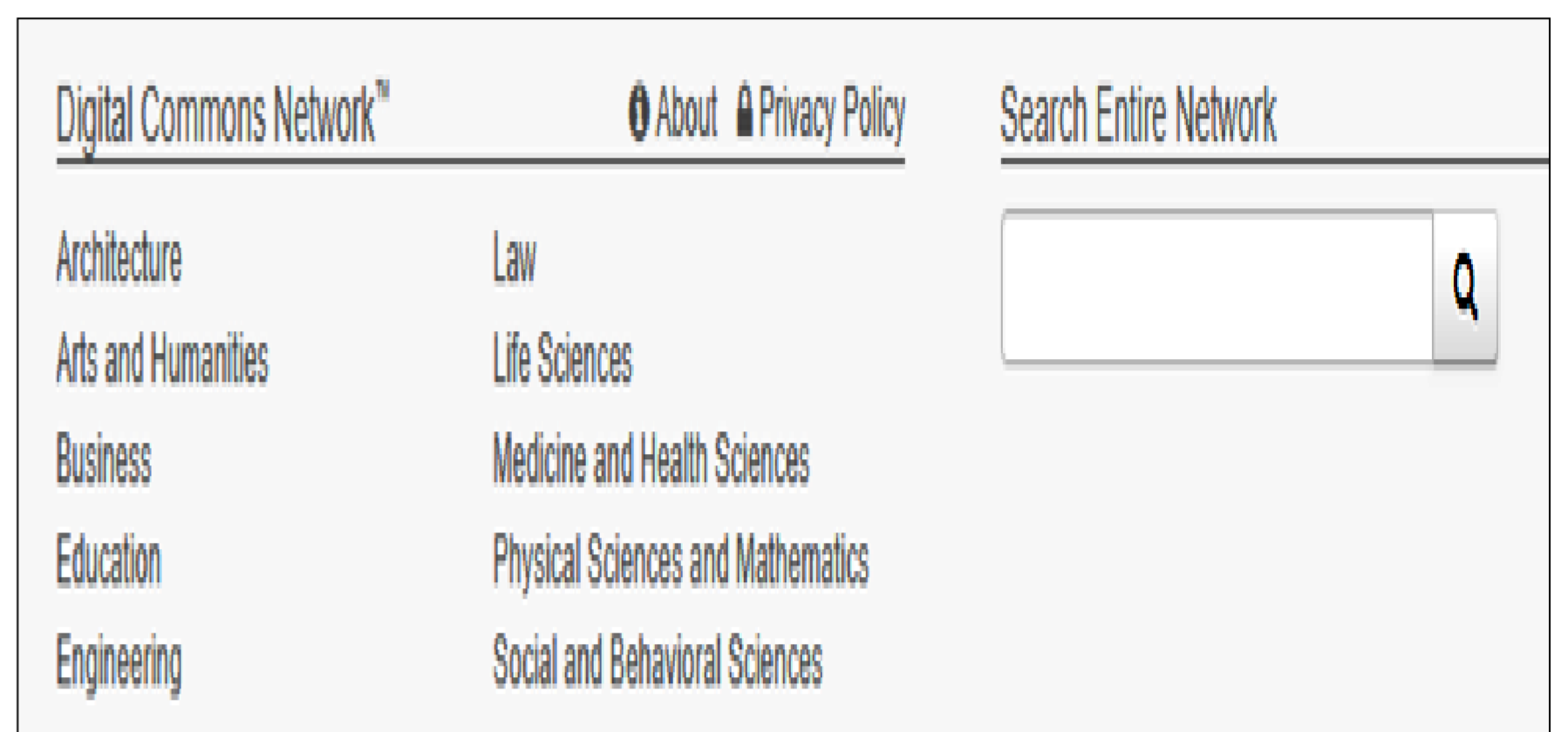
Categorías y box búsqueda

También contiene una casilla de búsqueda y un directorio temático en el sector inferior de la página inicial