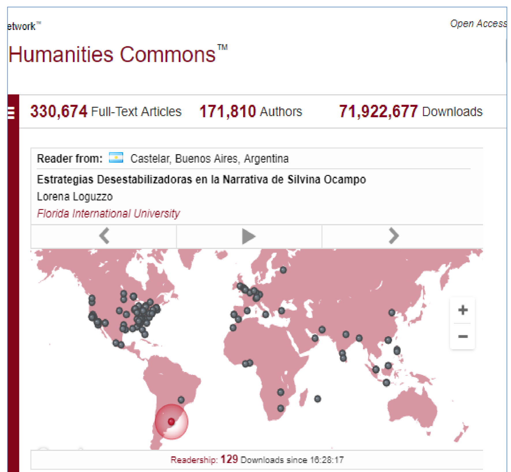
Mapa que indica en tiempo real la ubicación de los lectores y las descargas realizadas

Barra lateral derecha: Presenta la instituciones y los autores predominantes en esa categoría