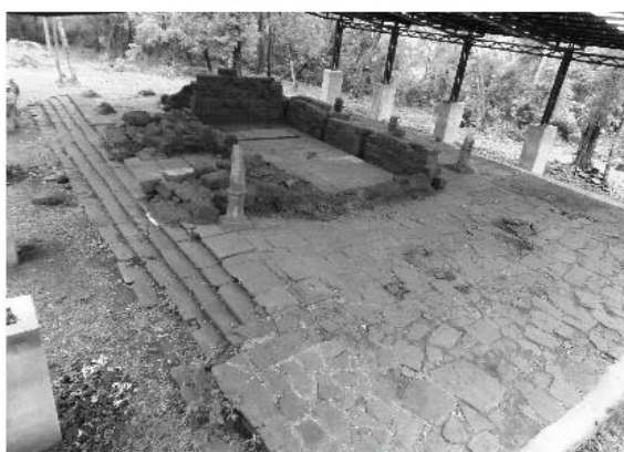
Capilla, Intervención finalizada