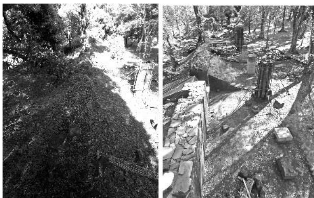
Templo, Muro Norte