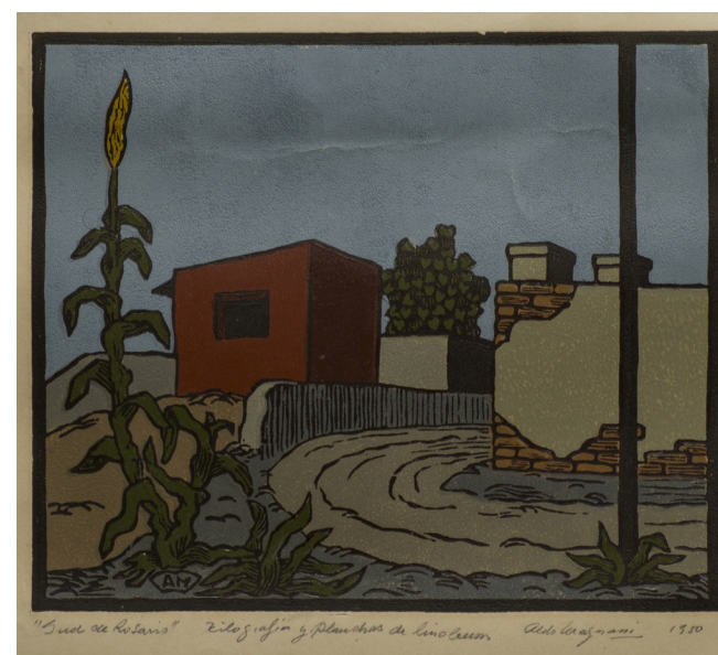
Aldo Magnani Sur de Rosario , 1950, xilografía y planchas de linóleo, colección particular.