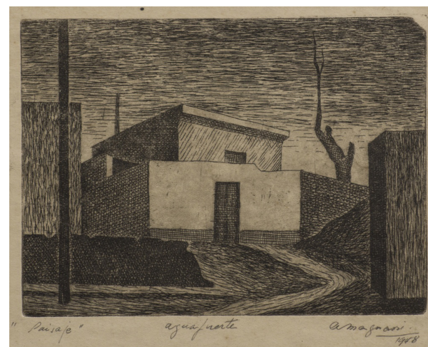
Aldo Magnani Paisaje , 1948, aguafuerte, colección particular.