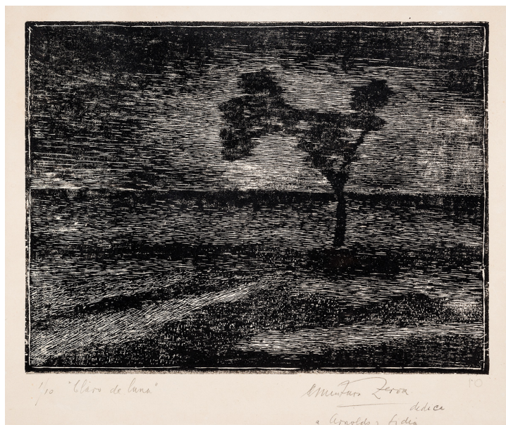
Santiago Minturn Zerva Claro de luna, s/f, xilografía, 20 x 25 cm, colección particular.