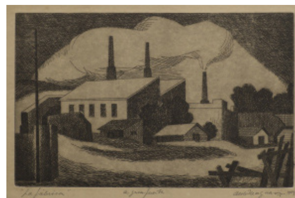
Aldo Magnani Fábrica , 1949, aguafuerte, colección particular.