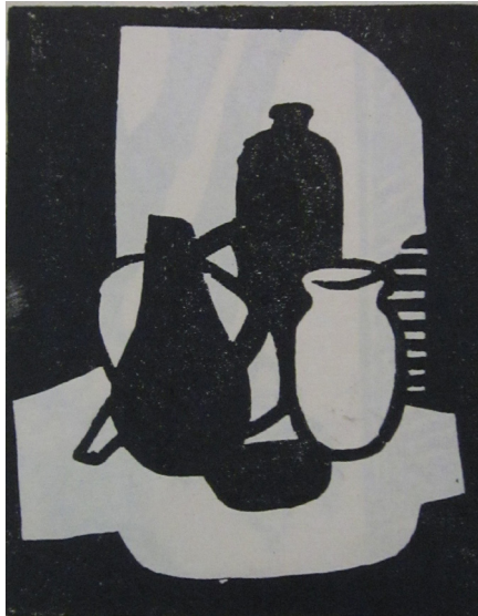
Rosa Aragone S/T, s/f, xilografía, colección particular.