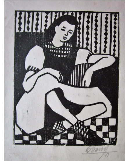
Clelia Barroso, S/T, 1951, xilografía, colección particular.