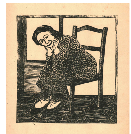
Flora Fiorini, S/T, s/f, xilografías, medidas variables, colección particular.