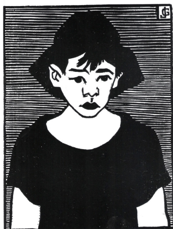
Juan Grela Sombbrero , 1950, xilografía, colección particular.

Como actividad constante, todos los años auspiciaban el Salón de Grabado realizado en Amigos del Arte, en el que actuaba un jurado de reconocidas figuras de la plástica y en algunos casos participaban artistas en