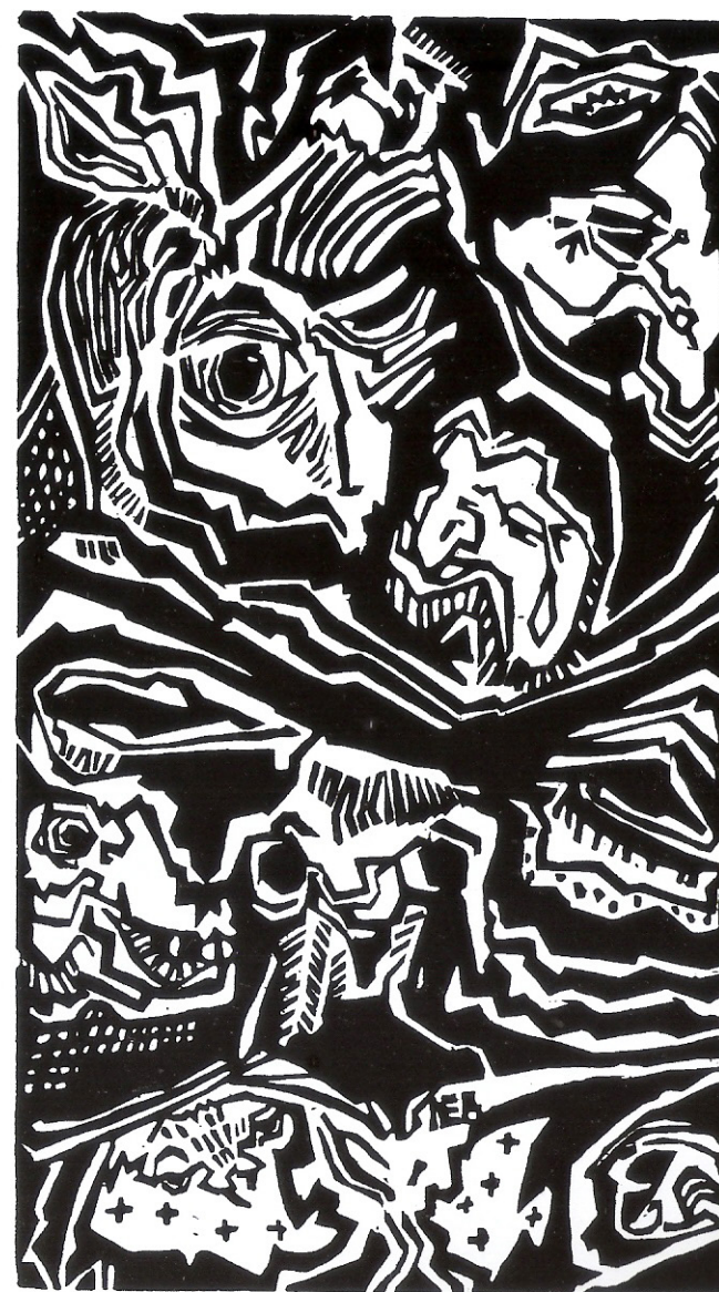
Mele Bruniard Pesadilla , 1955, xilografía, colección particular.

2 Cfr. "Reunión de grabadores", La Capital , Rosario, 16.XI.1951 y "Constituyose la Sociedad de Grabadores de Rosario", La Capital , Rosario, 17.XI.1951, Archivo AAAR.