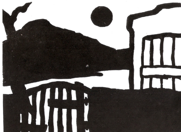
Rosa Aragone Nocturno, 1956, xilografía, colección particular.