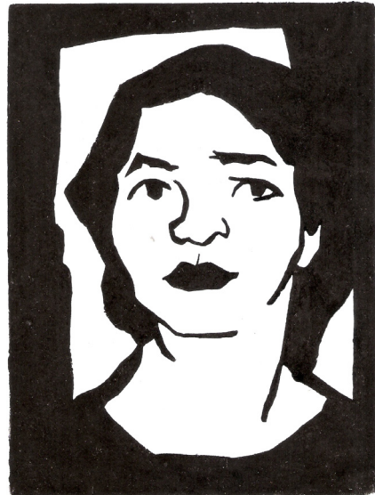
Rosa Aragone Una mujer, 1954, xilografía, colección particular.