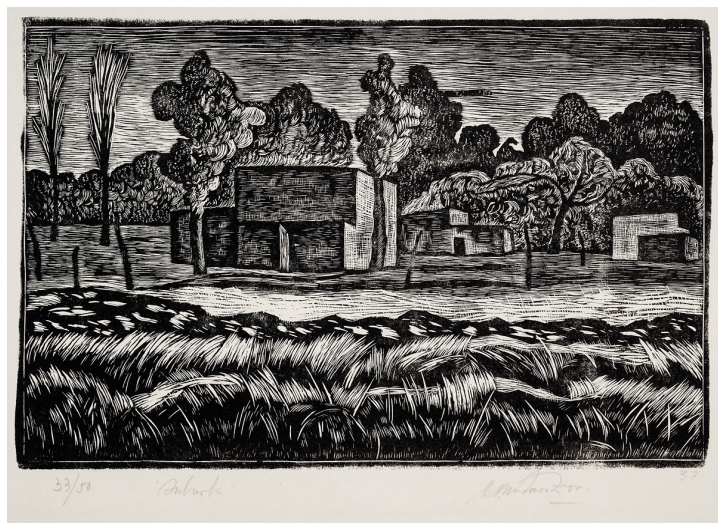
Santiago Minturn Zerva Suburbio, 1948, xilografía, 20 x 30 cm, colección particular.