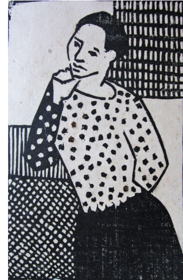
Clelia Barroso S/T, s/f, xilografía, colección particular.