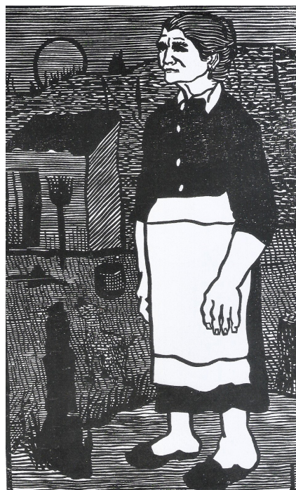
Juan Grela Una mujer , 1950, xilografía, colección particular.

calidad de “invitados de honor” como Gustavo Cochet, José Planas Casas, Minturn Zerva y Juan Grela. Con el objetivo de llevar el grabado a los barrios realizaron exposiciones, cursos y conferencias gratuitos para que los interesados por la técnica tuviesen la posibilidad de conocerla y practicarla. Esta tarea de difusión que enfatizaba la explicación técnica era un rasgo propio de las iniciativas tendientes a promover el grabado realizadas durante esos años; en ese sentido, el dominio de la técnica, la labor artesanal y la destreza manual del artista para la factura de la estampa, constituyeron importantes fuentes de valoración.