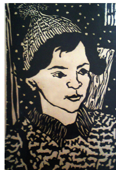
Zulema Piazza Con gorro, 1955, xilografía, colección particular.