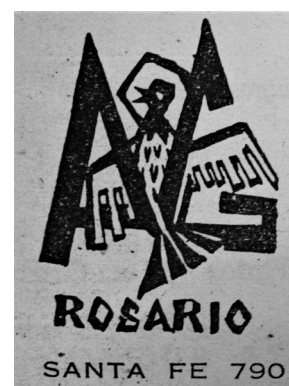
Logotipo de la Agrupación de Grabadores de Rosario, Catálogo de muestra Homenaje a Rembrandt a los 300 años de su nacimiento, Rosario, AAAR, 1956.

Una característica de este conjunto fue la gran participación de artistas mujeres, jóvenes egresadas del Profesorado de Dibujo, luego devenido en escuela universitaria, y alumnas del taller de Grela. Esta particularidad se