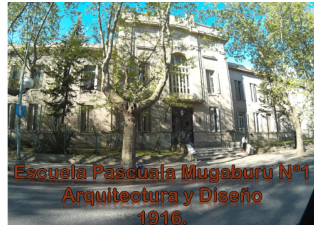
Figura N° 1. Relación de Tipologías. Vinculaciones con corrientes a nivel nacional. Relación con Corrientes y Estilos Internacionales, Valores Ideales,