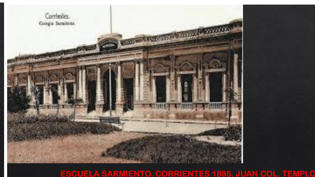
Figura N° 2. Observación. Formas de organización volumétrica y funcionales