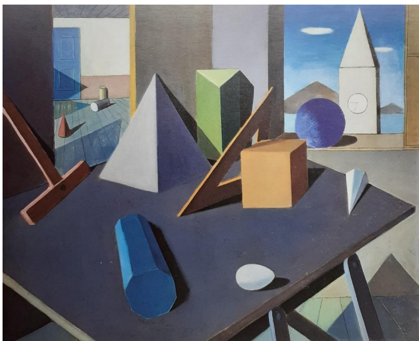
"Naturaleza muerta" Milton Dacosta, 1942 – 60 x73 cm

El tratamiento de la luz en el arte, tanto en las técnicas de las artes visuales como en la teoría del arte y de la estética es un tema muy estudiado a través del tiempo. No solamente se limita a la representación de la luz y la sombra, sino también a la iluminación que deben recibir las obras de arte en su exhibición e incluso la luz como parte esencial de determinadas obras.