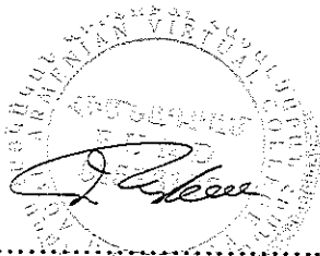
..... Director Ejecutivo Colegio Virtual Armenio UGAB

En fe de lo cual, los representantes debidamente autorizados firman dos (2) ejemplares en cada idioma, quedando un ejemplar para cada una de las partes.