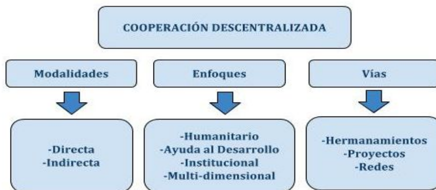
Cuadro 1- Fuente: Elaboración propia a partir de los aportes de Enríquez y Ortega.