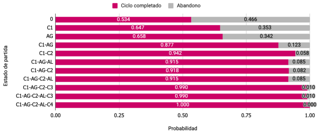
Figura 3. Probabilidades estimadas de absorción para diferentes estados de partida.