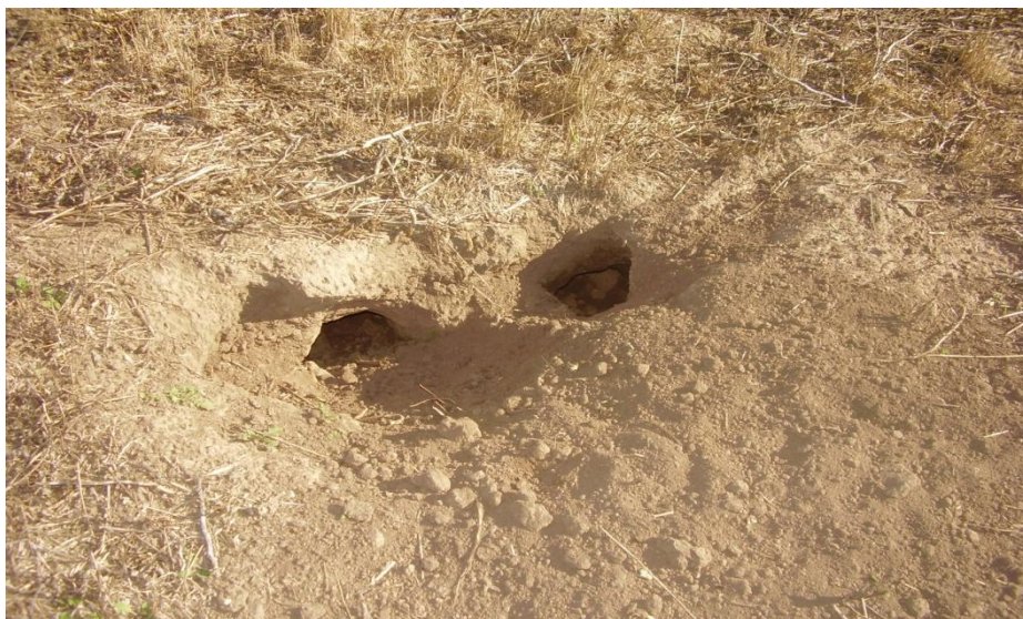
Figura 3. Alteración del sitio. Cuevas de Peludo.

Este informe, como habíamos aclarado, es parte de la fase exploratoria del proyecto, en la que nos proponemos la realización de lecturas de fuentes documentales, tanto de viajeros como de historiadores, la consideración del registro oral, y además exploraremos la posibilidad de las fotografías aéreas.