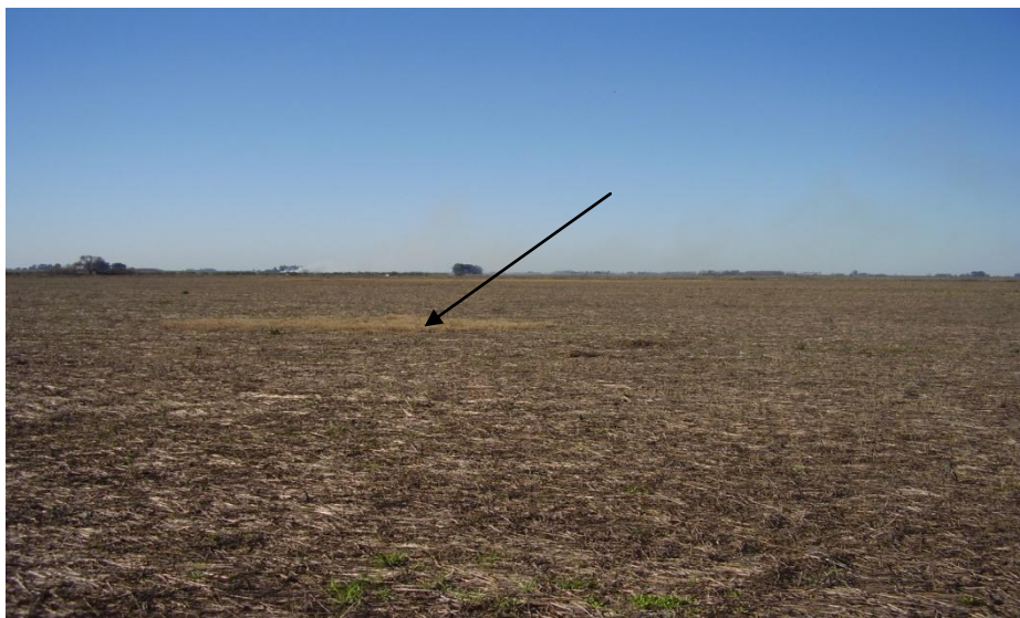
Figura 2. Leve Ondulación sobre el terreno.

Este informe, como habíamos aclarado, es parte de la fase exploratoria del proyecto, en la que nos proponemos la realización de lecturas de fuentes documentales, tanto de viajeros como de historiadores, la consideración del registro oral, y además exploraremos la posibilidad de las fotografías aéreas.