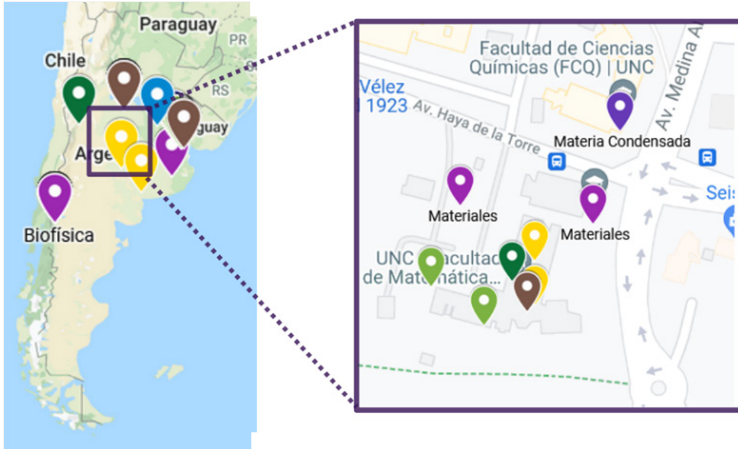
Figura 1. Ilustración del mapa de la Red de Físicas

plataforma de Google Maps. La aplicación permite realizar búsquedas por nombre o palabra clave y hacer magnificaciones en distintas regiones del país para identificar a las investigadoras con sus lugares de trabajo. A modo de ejemplo, en la figura se muestran las investigadoras de la Red de la ciudad de Córdoba; los diferentes colores indican las disciplinas correspondientes (violeta: materia condensada, verde: biofísica, etc). La Red también incluye físicas argentinas que trabajan en el extranjero. Confiamos en que este recurso sea de utilidad para la comunidad científica en general.