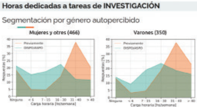
Figura 3. Tiempos dedicados a la investigación según género