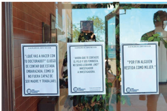
Figura 1. Así amaneció el CENPAT el 8 de marzo de 2018

día con un CENPAT sin mujeres y con la mayoría de las paredes y ventanas del edificio empapeladas con los resultados de la encuesta y los comentarios que nuestras compañeras habían compartido (Figura 1). Muchos de nuestros compañeros se solidarizaron, aunque la mayoría incrédulos de lo que estábamos diciendo. También hubo muchos otros que se enojaron, otros no entendían cómo nos “habían dejado hacer eso” y hasta hubo quienes manifestaron que merecíamos ser castigadas. Además de la acción con los carteles, elaboramos un informe con los resultados de la encuesta que presentamos a las autoridades y también en un plenario abierto a sala llena en el auditorio del CENPAT. Es a partir de estas primeras acciones que logramos algo que no existía en ninguna dependencia del CONICET: se aprobó la creación de un Comité Institucional de Políticas de Género (CIPG). El CIPG constituyó el reconocimiento institucional de nuestras demandas y del accionar de La Colectiva.