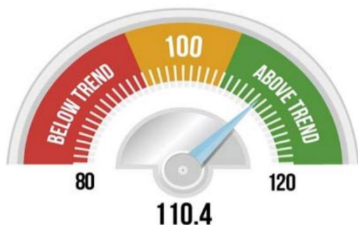
Goods trade barometer Index value, June 2021 = 110.4

El índice de productos de la industria del automóvil (106,6) también aumentó, pese a que la producción y la venta de automóviles disminuyeron en julio en algunos países a causa de la escasez de semiconductores (el aumento puede explicarse por la atenuación de los datos subyacentes). Esta escasez también queda reflejada en una pequeña disminución del índice de los componentes electrónicos (112,4) en comparación con el mes de