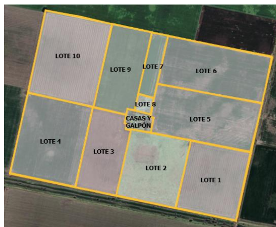
Gráfico II: Distribución de la superficie del establecimiento en lotes