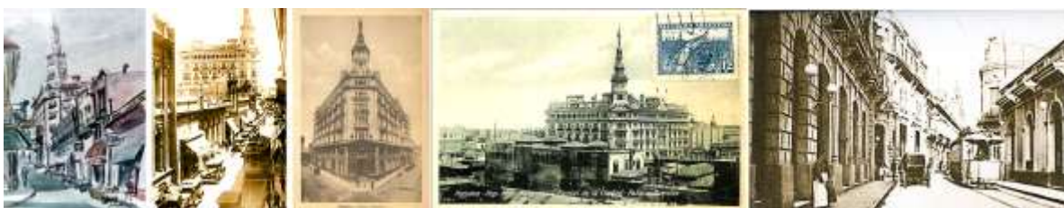
Fig. 5. PALACIO FUENTES 1925.

4.1 Postal del año 1929. 4.2 Planta. 4.3 a 4.6 fotografías del Palacio Cabanellas.