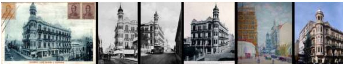
Fig. 2. EDIFICIO "LA AGRÍCOLA" 1907.

El primero, en 1906 fue proyectado por el arq. Eduardo Le Monnier 3 , alojó la sede local de la sociedad de ahorro mutuo La Bola de Nieve y oficinas en los pisos altos. Al año siguiente, la modalidad se repitió, esta vez combinado con unidades de vivienda en el edificio para la Compañía de Seguros La Agrícola, proyectado por el arquitecto F. Collivadino.