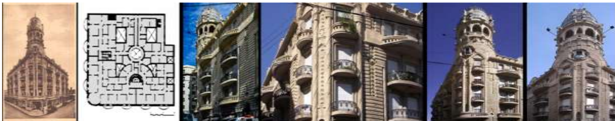
Fig. 4. PALACIO CABANELLAS 1914.

Los casos se sucedieron, con nutrida aceptación en la modalidad de inversión por parte de comitentes privados, que emprendieron los llamados palacios que perpetuaron con su designación la memoria de sus dueños. (Palacio Cabanellas, Palacio Fuentes, Palacio Minetti entre otros).