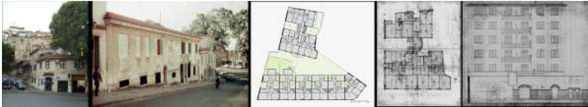
Fig. 7. EDIFICIO CANEPA. Año 1929.

Cambios, modernizaciones, aceptación de nuevos roles y consideración de inéditos protagonistas que ejercen su acción dentro de un mismo espacio central de aquella ciudad (Roca, 2005).