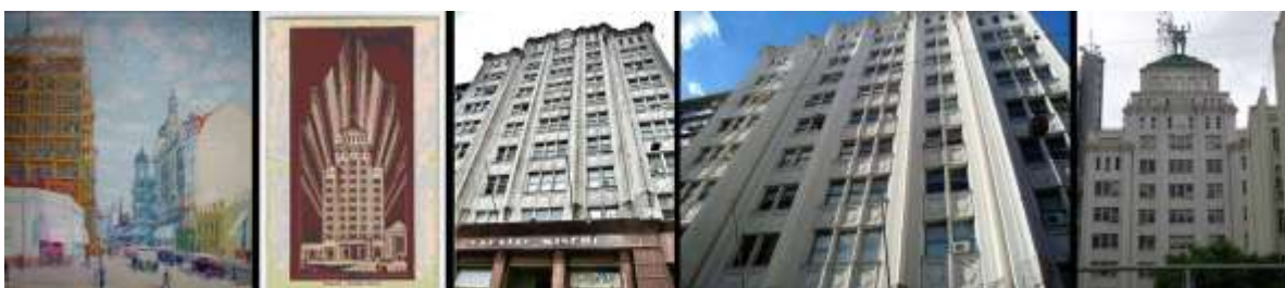
Fig. 6. PALACIO MINETTI 1929.

5.1 Imagen del Palacio del pintor Rodriguez Cilli. 5.2, a .4 fotografías del Palacio Fuentes. 5.5- Fotografía de calle Santa Fe hacia calle Sarmiento.