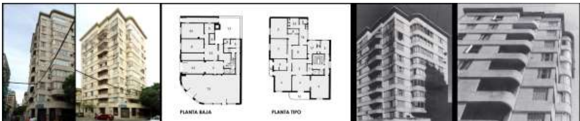
Fig. 9. EDIFICIO PARA RENTA “ARIJÓN”. Año 1932

A partir del reconocimiento del estado de situación, de la presentación, selección y estudio preliminar de casos, se efectuó un relevamiento de conjuntos de vivienda bajas, y de edificios de renta de mayor altura (1900-1950) que constituyó un material de trabajo integrado por legajos, fotografías y planos urbanos que forman la base de la investigación.