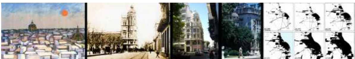
Fig.1. LA CIUDAD Y EL EDIFICIO “BOLA DE NIEVE”.

Los edificios de renta causaron un fuerte impacto, a partir del principio del siglo XX, en el horizonte de la ciudad de Rosario. Estas obras en altura constituyeron una novedad en el mercado inmobiliario. Hitos calificados de un innegable rol preponderante, buscado ex profeso.