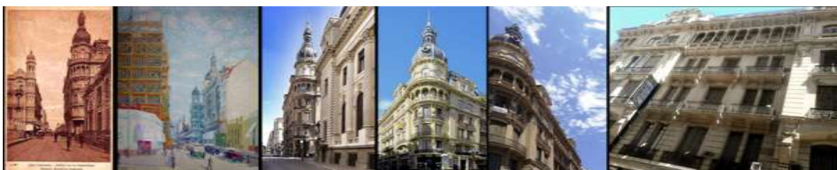
Fig. 3. EDIFICIO "LA INMOBILIARIA" 1914.

2.1. Postal de época. 2.2 a 2.4 fotografías del pasado. 2.5 Pintura de C. Uriarte, donde al fondo se aprecia el edificio de La agrícola. 2.6 fotografía del presente.