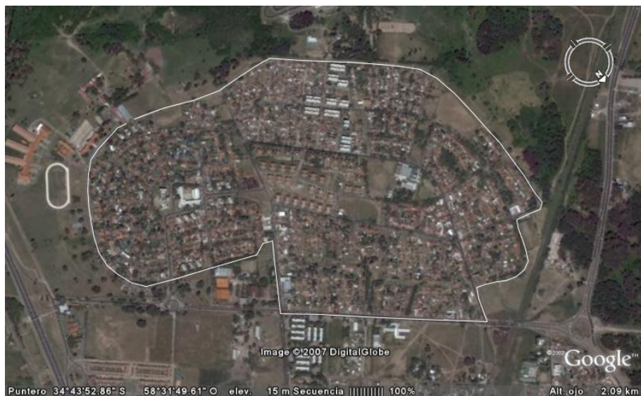
Figura 3: Imagen satelital de Ciudad Evita