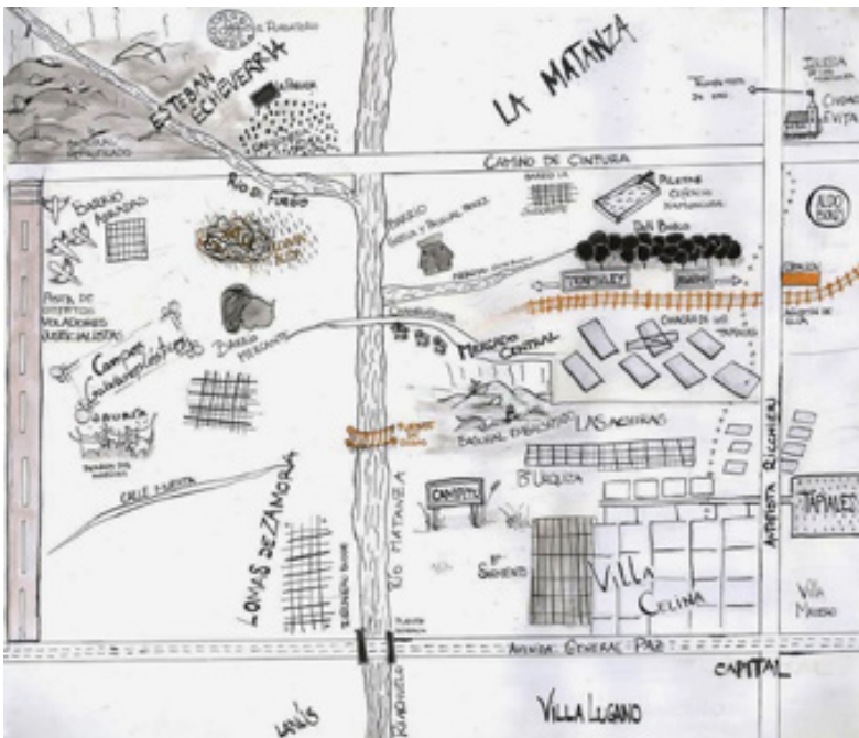
Figura 1: Mapa incluido en El campito de Juan Diego Incardona

Entre las diversas propuestas narrativas que se ofrecen al análisis, El campito de J. D. Incardona (2009) llama particularmente la atención por la densidad de su simbolismo y el relieve que adquiere allí el factor territorial como actualizador de la identidad desde un discurso que se presenta como lateral o de margen—Juan Diego Incardona es un escritor proveniente de la clase media trabajadora, que reivindica al comienzo de su actividad literaria, la coexistencia de ésta con diversas actividades de “buscavidas”, posicionándose fuera del circuito literario culto o canónico. Pero más particularmente, porque Incardona decidió incluir en El campito un mapa de su propia autoría que representa el locus de la historia, lo cual denota una particular preocupación por la representación espacial y que proponemos como plataforma de partida de una lectura de su cartografía, aunque sin desdeñar el contrapunto textual.