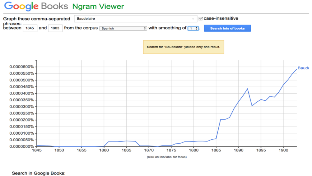
Fig.1 Ngram de Baudelaire en el corpus de Google books en español.