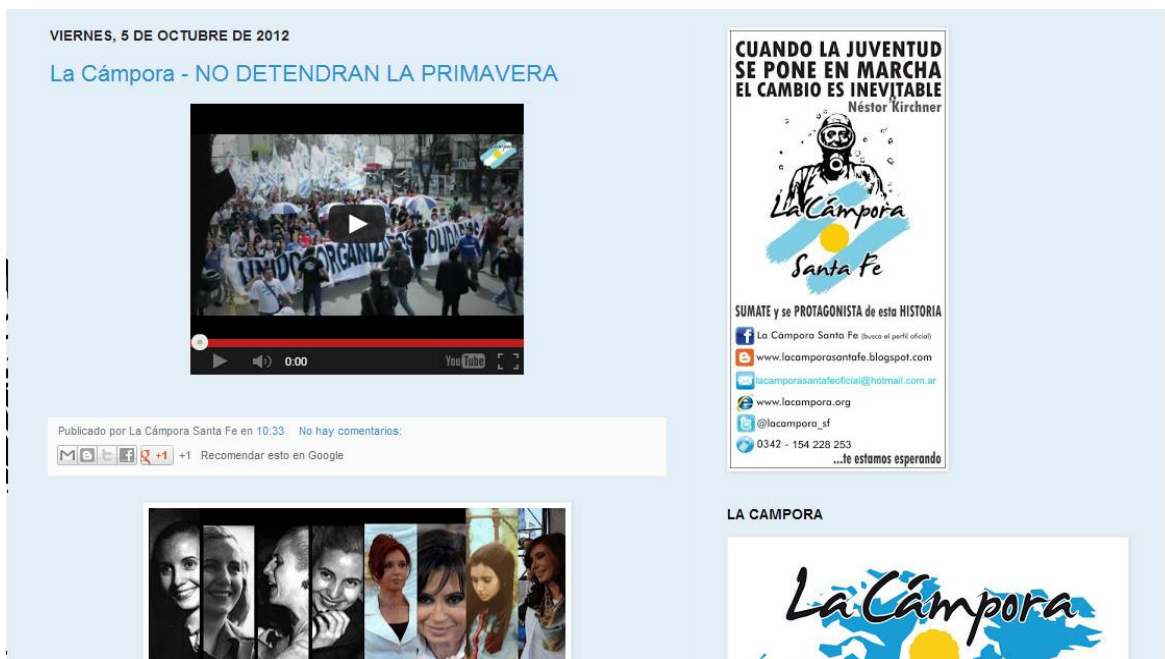
IMAGEN V: blog de Santa Fe