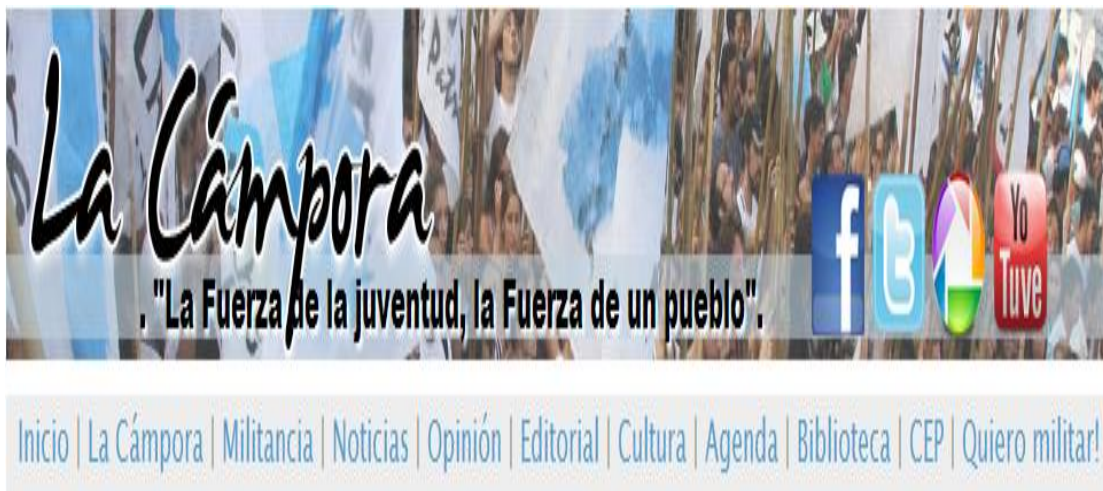
IMAGEN I: Banner de cabecera, 11 secciones.

Desde la fecha de inicio del sitio, pasaron de 5 a 11 el número de secciones. Sólo una aplicación (llamada “Foro”) dejó de funcionar el 5 de agosto del 2010. Como el nombre lo indica, el espacio estaba destinado a realizar intercambios entre usuarios desde la página Web.