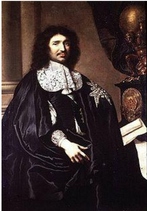
Jean Baptiste Colbert

Esta política económica fue practicada en Francia entre 1661 y 1683, fecha de la muerte de Colbert. Sin embargo fue continuada con algunas modificaciones por sus sucesores.