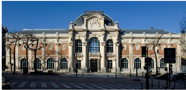
Talleres Gobelinos de París

nos, que dispone de 15 telares, y continúa produciendo los mejores tapices de París. Los apoyos otorgados a sectores de la industria francesa de la época -conocidos como el sector de "Manufactures privilégiées", que tenían un sistema de producción muy regulado a fin de garantizar alta calidad- no fueron concebidos como de plazo indefinido. El objetivo era que las