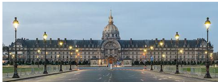
Hospital de los Inválidos, París.

"públicos" propios de la época, algunos construidos específicamente para dar una sede a instituciones que contribuían al prestigio y grandeza del país, tales como el Instituto de Francia que recibió, entre otras grandes instituciones, la re-