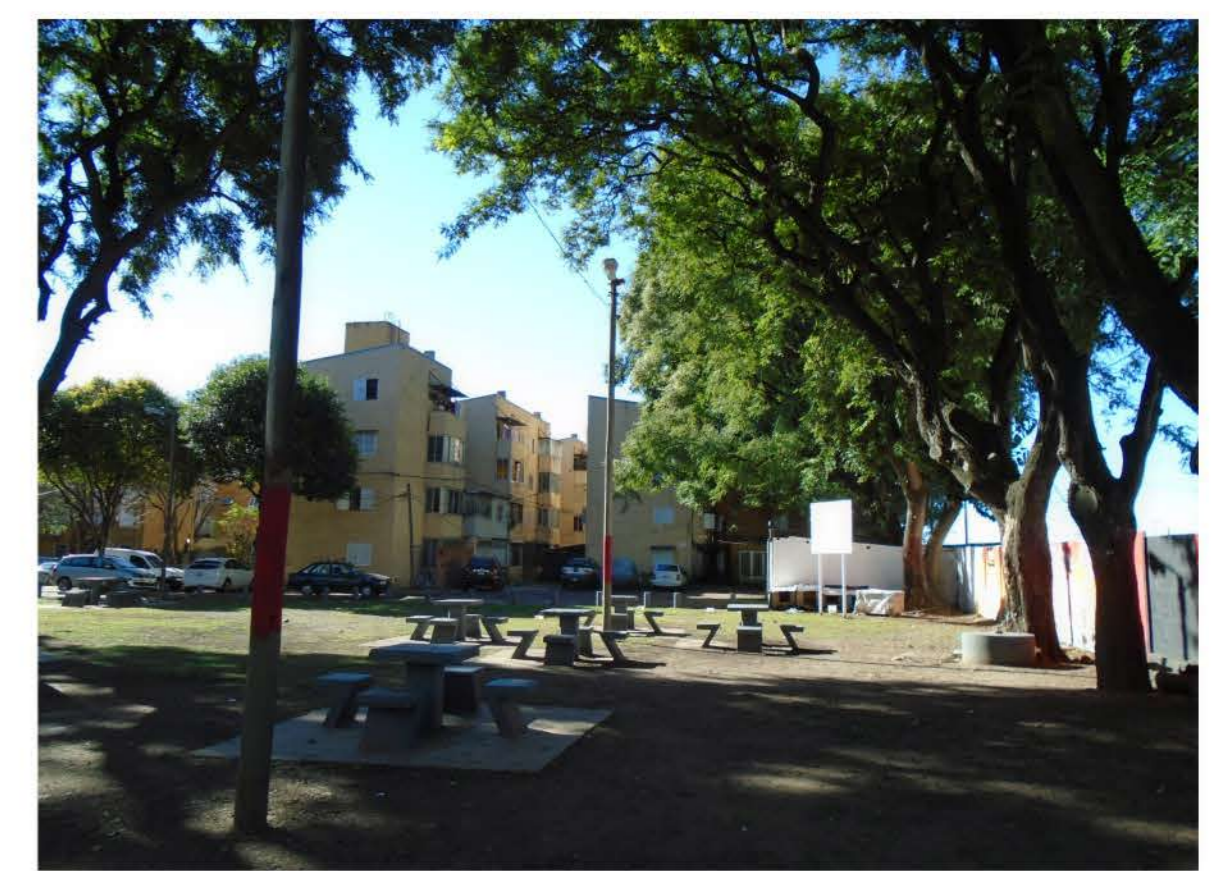
Restauración de espacios públicos: plaza Roberto Walsh