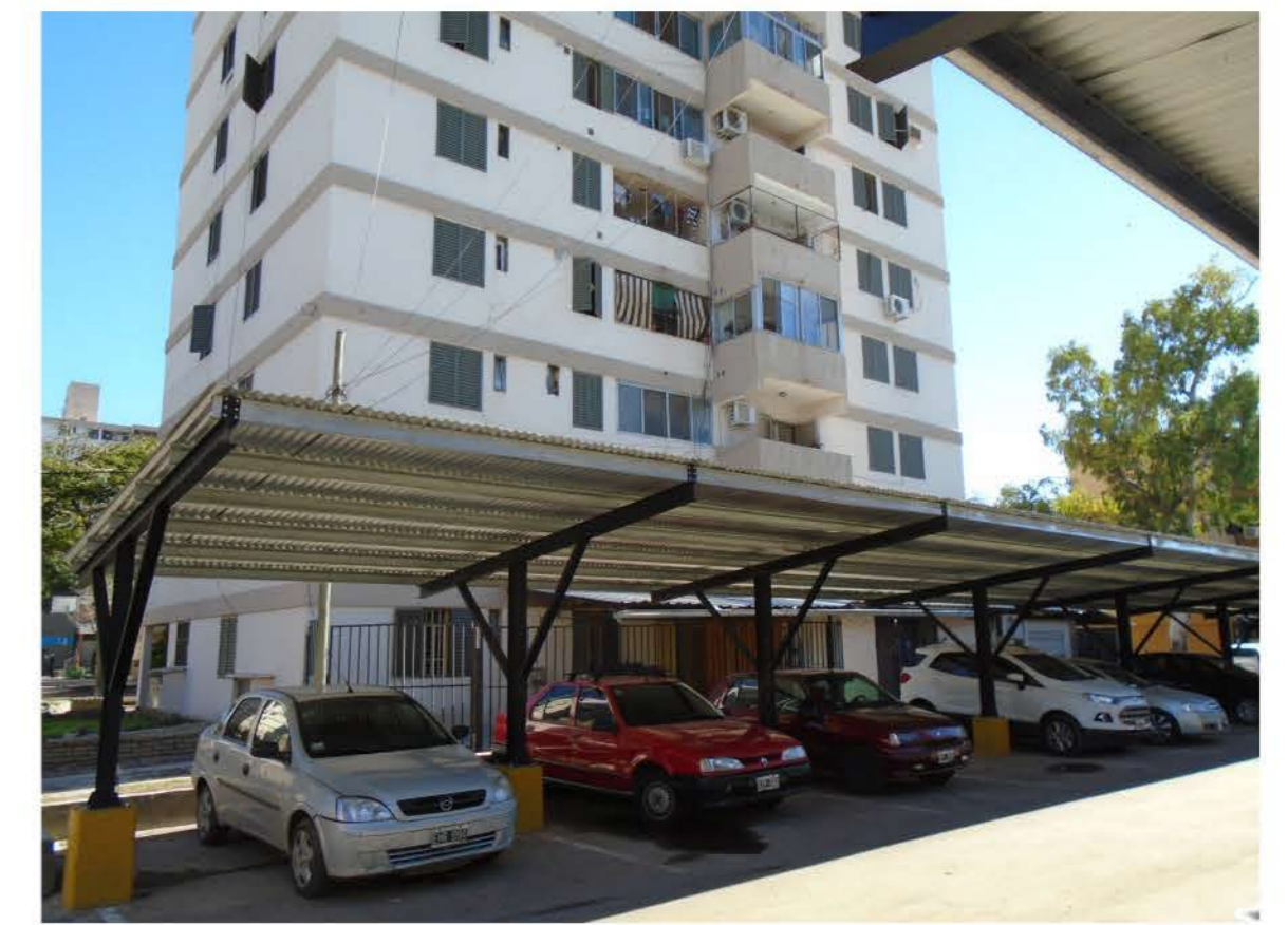
Instalación de cocheras semicubiertas