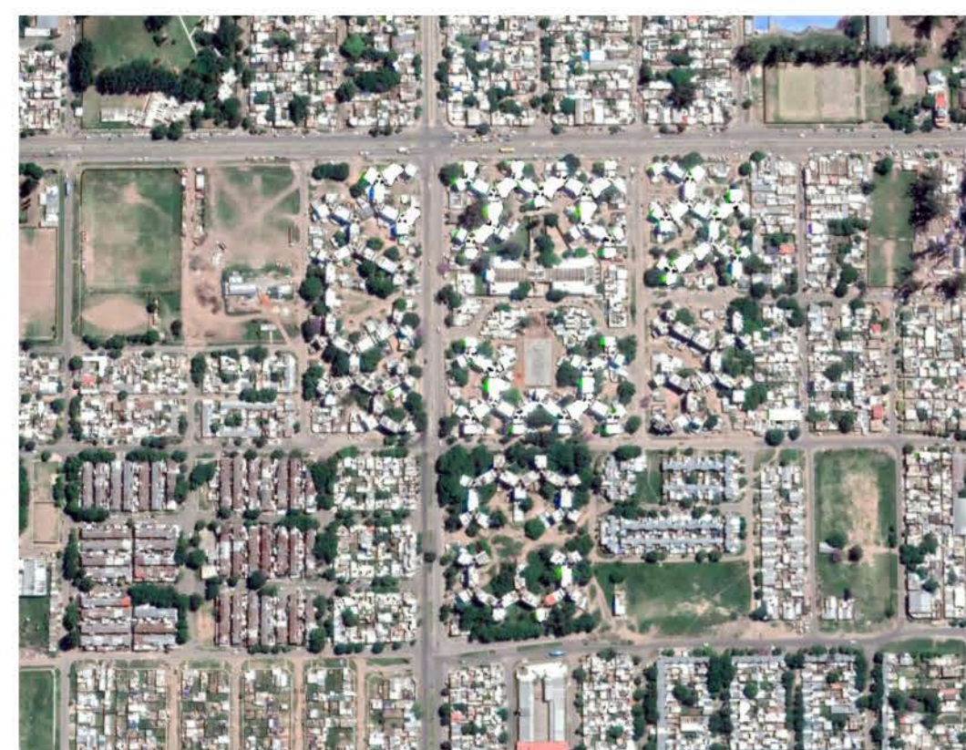
Sector Bv. Seguí y Rouillón

La cuarta etapa incluye la elaboración de un diagnóstico sobre los resultados alcanzados por los planes de mejoramiento de la vivienda social, que permitirá una lectura sobre las repercusiones de dichos planes en los aspectos físico-espaciales y sociales, y su impacto en el barrio. Este diagnóstico contribuirá al estudio de recomendaciones aplicables a proyectos futuros de recuperación de conjuntos de vivienda para los sectores de bajos recursos.