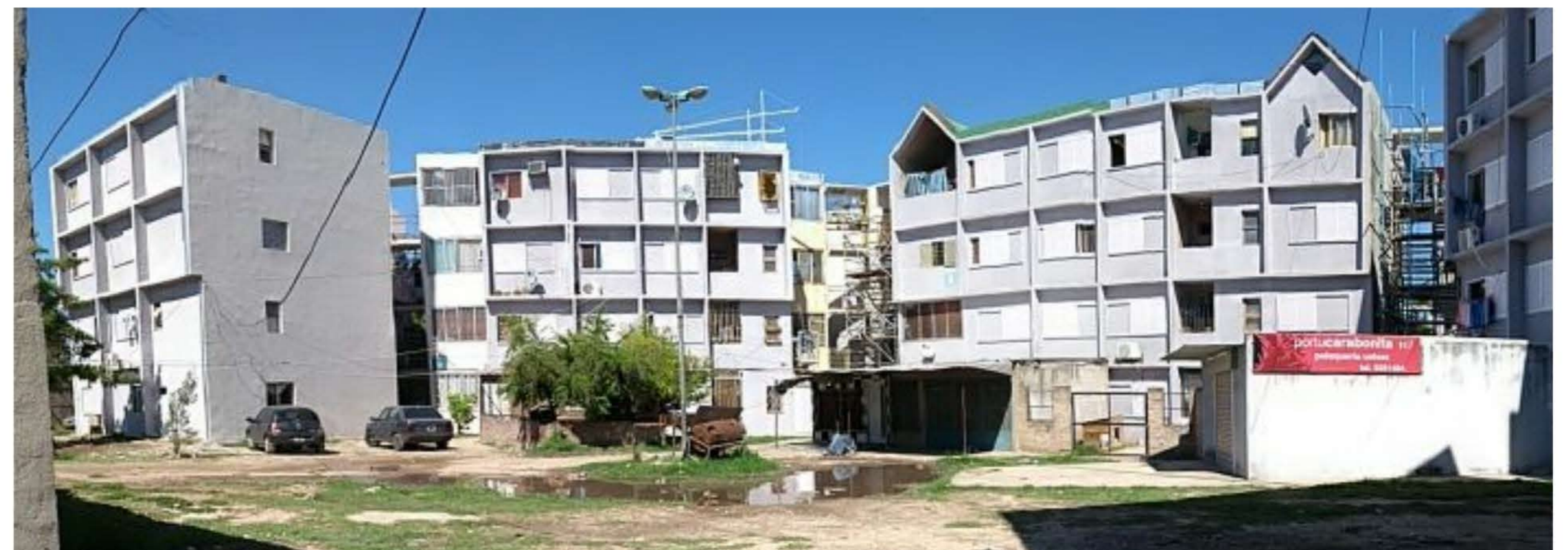
Renovación de fachadas (reparación, pintura)