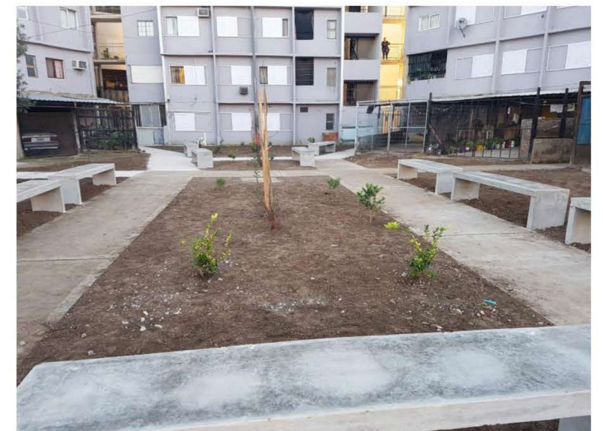
Restauración de espacios públicos