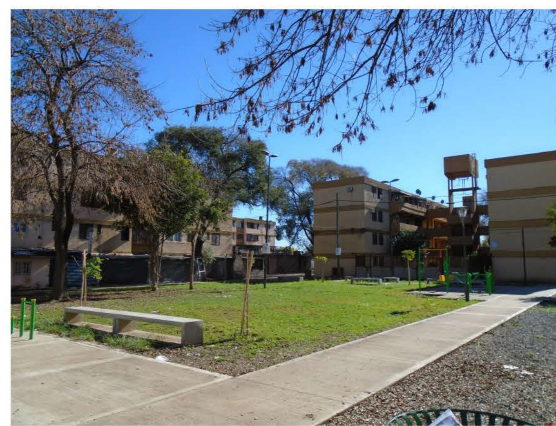
Restauración de espacios públicos