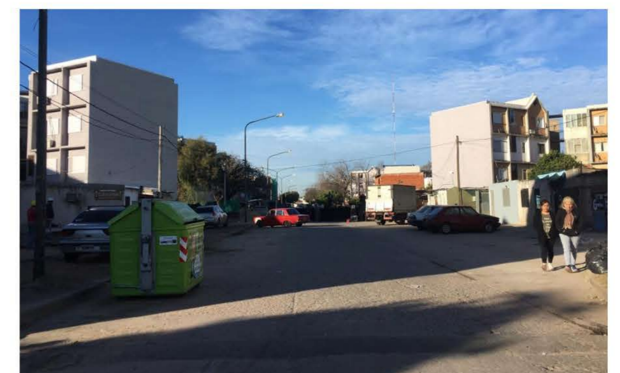
Restauración de pavimentos y veredas