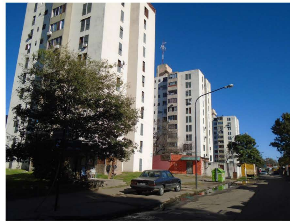
Renovación de fachadas (reparación, pintura)