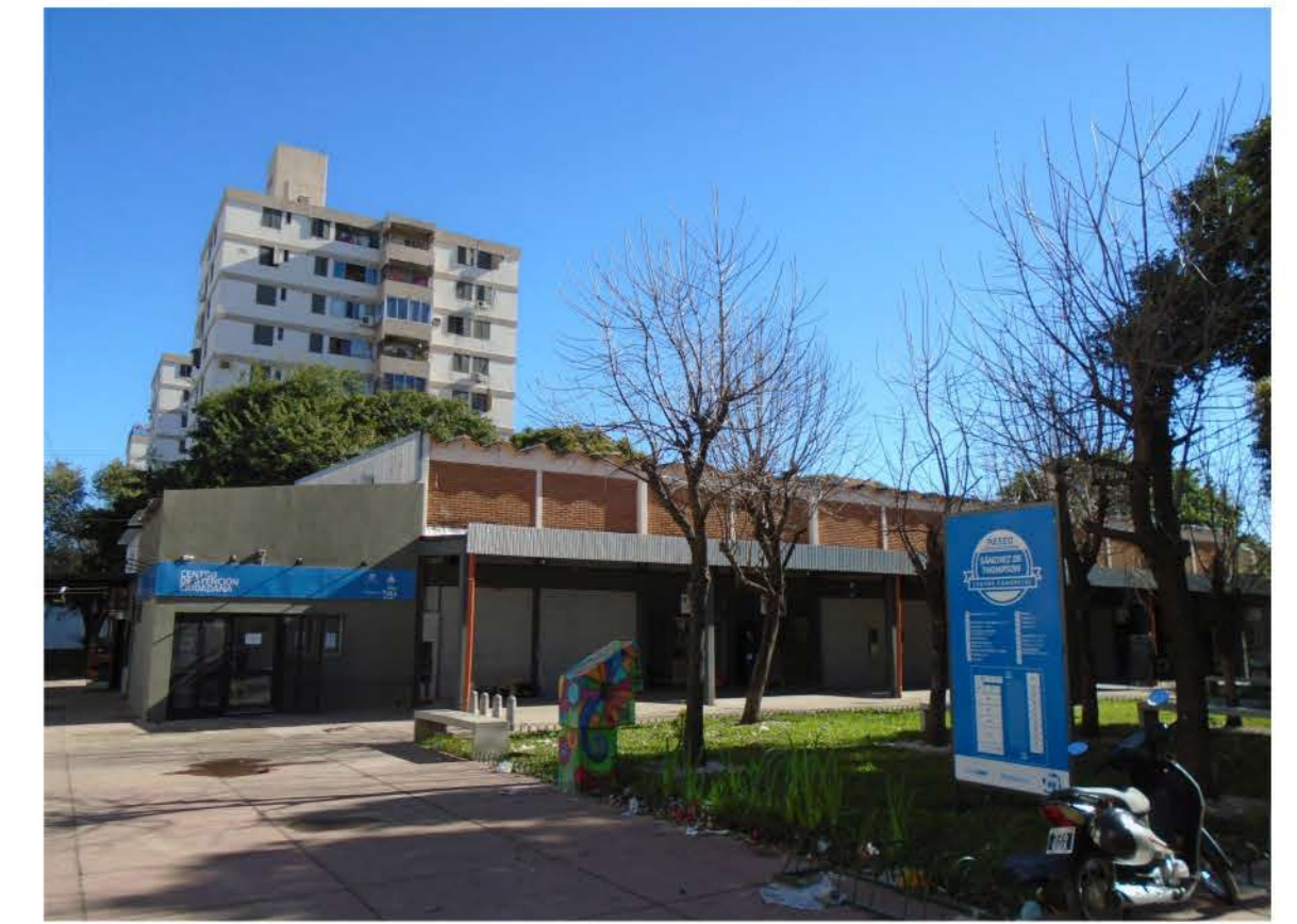
Equipamiento del barrio: Centro Comercial