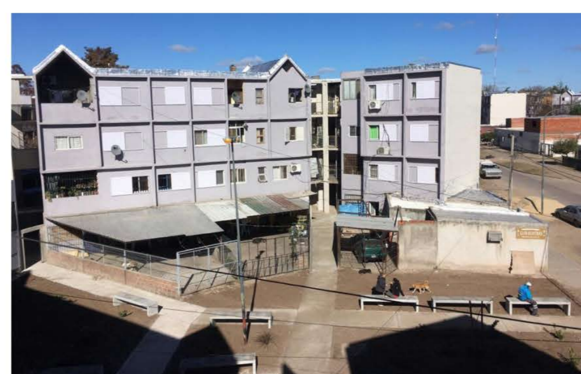
Restauración de espacios públicos