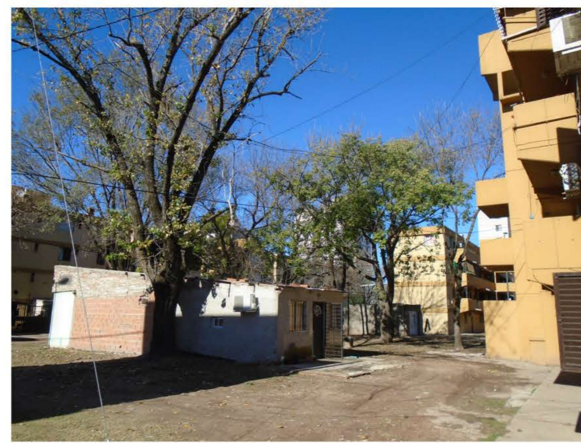
Todavía se observan lugares públicos invadidos con construcciones irregulares