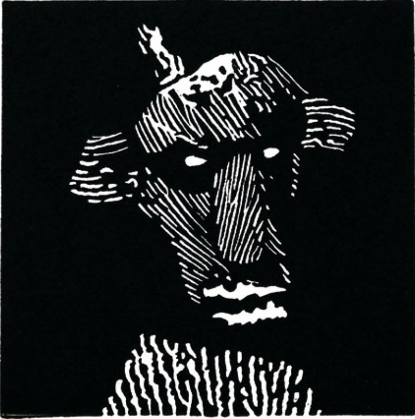
Figura 2 Lukasz Cywick (Polonia) "Mr. Time" Grabado en linóleo