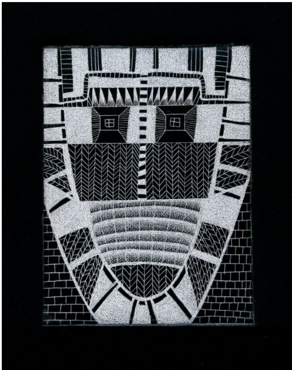
Figura 5 María Chiara Toni (Italia) "Maschera" Punta seca s/plexiglás