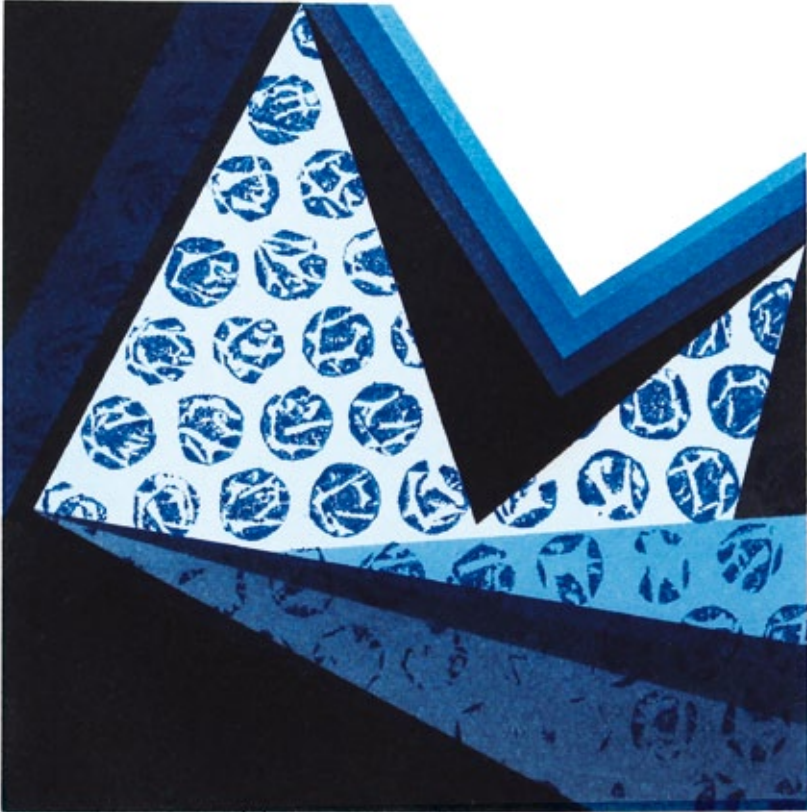
Figura 4 Tadataka Kudou (Japón) "Time 14-2" Técnica mixta