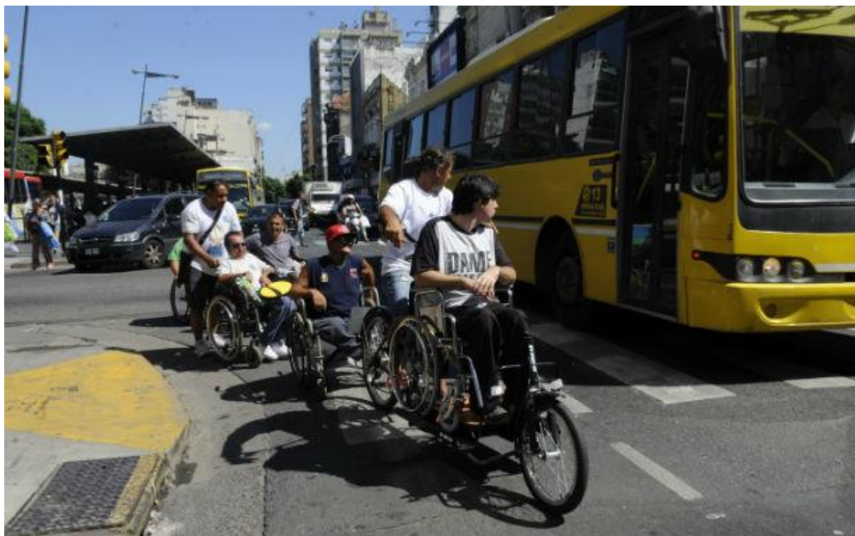
Rally edición 2015, cruzando calle Entre Ríos miembros de Sin Barreras en un silla de ruedas