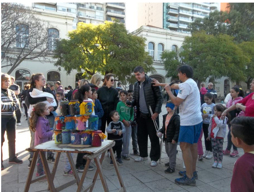
Por Amor al Deporte 2017. Participante ciego y participante con los ojos vendados

Es así como se entiende a la comunicación como un proceso de co-producción de sentido desde el cual –a través y por el lenguaje– se configura y transforma la experiencia propia y la del otro. La comunicación en este caso es acción, modifica el contexto. Es un encuentro con el otro.