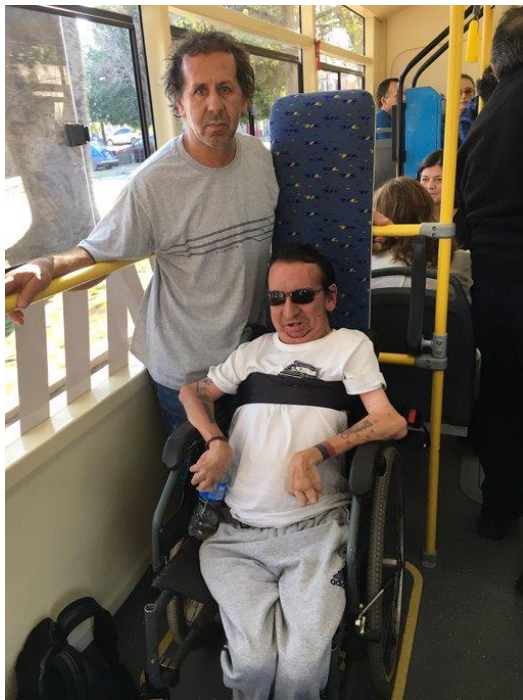
Viaje inaugural de la línea Q

Actualmente Sin barreras tiene un perfil en Facebook donde tiene 139 seguidores, comparte actividades propias, con me gusta y compartido por los usuarios y datos útiles de otras organizaciones, sin embargo tiene poca interacción sobre sus propias actividades. También tiene un canal de You Tube donde hay videos sobre la historia de Sin Barreras, entrevistas en canales de televisión, eventos propios. Un perfil de Twitter donde comparten algunos datos propios y eventos municipales sobre discapacidad en los que han participado, como por ejemplo inauguración de juegos inclusivo en plaza Aviador, viaje inaugural de la línea Q (mostrando que los coches de la nueva línea son adaptados para personas con movilidad reducida).. Todas las redes sociales son administradas por el presidente de la organización. En este momento Sin Barreras no tiene página web por fue hackeada. Podemos ver que hoy no es la estrategia más utilizada por la organización.