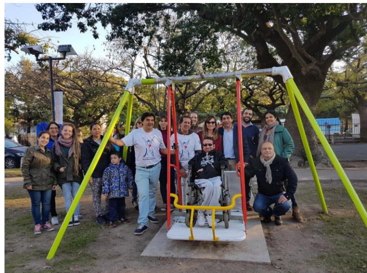
Juegos inclusivos en Plaza El Aviador