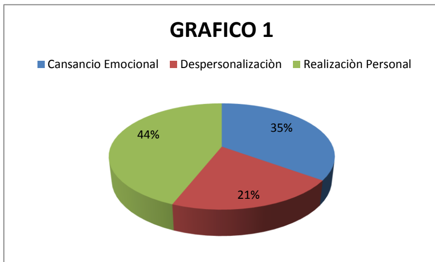
Cuestionario MBI administrado a los 6 meses de su desempeño en la Central 911

En el primer gráfico se representan los resultados aportados a los seis meses de su ingreso como telefonistas. En el segundo gráfico, al año de su desempeño.